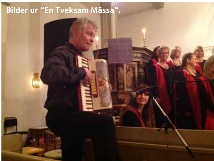
Bilder ur "En Tveksam Mässa".

Visst kan man ha både dragspel och tango i en mässa!