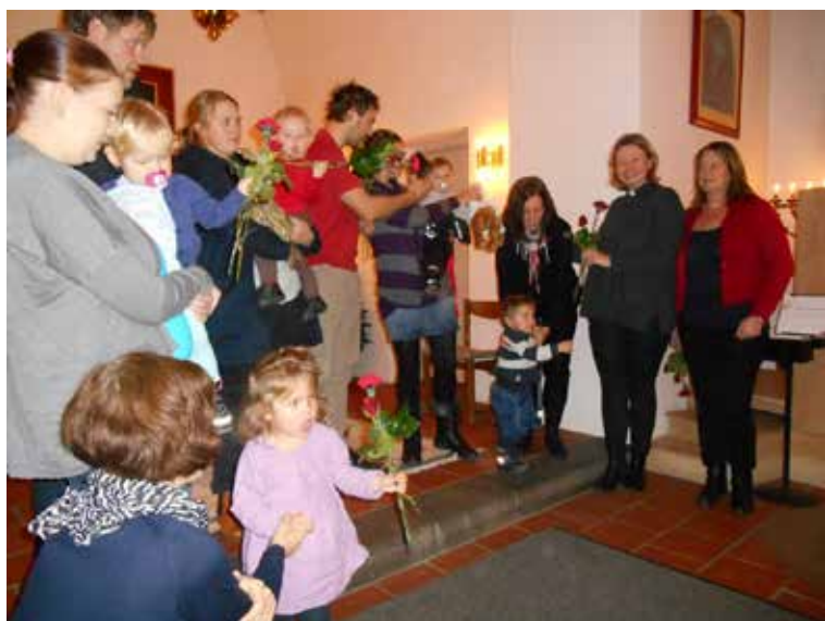
Våra nya barn med familjer hälsades välkomna vid en gudstjänst i Tomelilla kyrka.