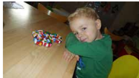
Pärlfrossa på gång! Barnen älskar pyssla med pärlor.