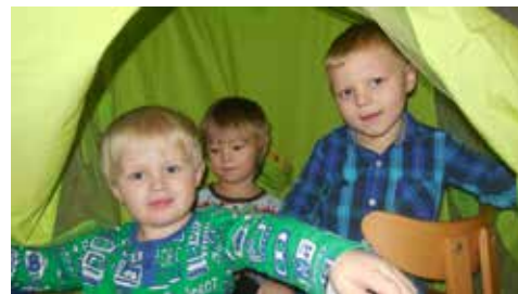
Här är vi! Inne i kojan!

26/3 kl. 18.00 – 19.30 i Församlingshemmet i Tomelilla. Vill du sälja leksaker och barnkläder? Bordsbokning på tel. 0417 – 142 05 el 142 06. 100:- /bord. Pengarna för bordshyran går till Fasteinsamlingen.