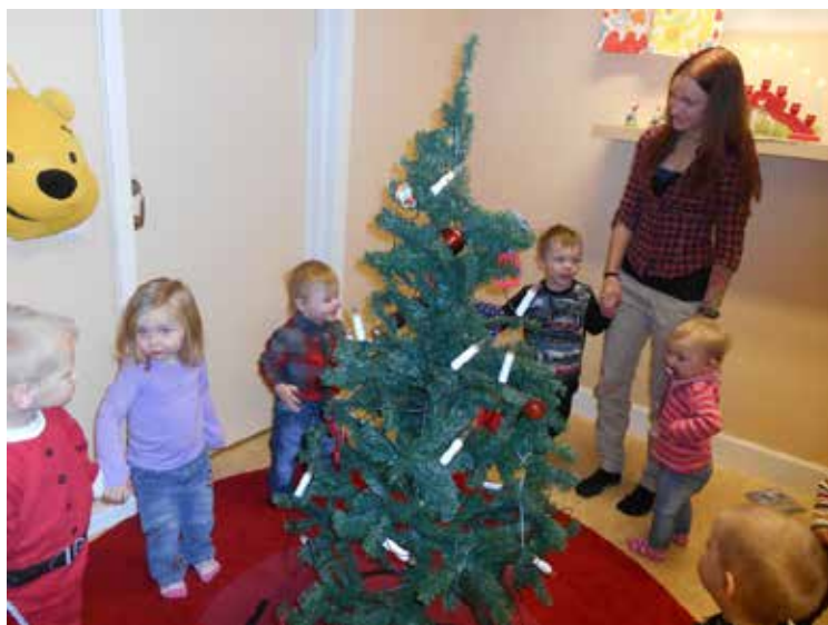
Barnen på Pigge dansade runt julgranen på vår julfest.