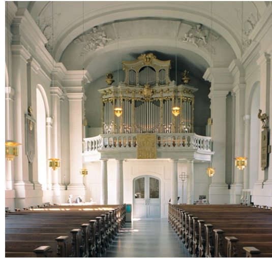
Kyrkorummet mot orgelläktaren.

På predikstolens motsvarande plats i söder sitter ett monument över Cartesius (René Descartes, 1596–1650). Det är utfört av Sergel 1781 och