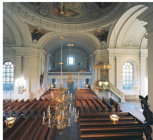
Kyrkorummet från den södra läktaren mot den norra.

Koret ligger tre trappsteg över kyrkorummets golv. Trappan av kalksten är lika bred som kolet , vars golv också är av kalksten. Väggar och tak är utformade likt övriga kyrkans. Altartavlan av Tobias Sergel (1740–1814) är en relief av gips som föreställer Kristus uppstigande ur graven. Ovanför denna sitter ett strålknippe. Alta-