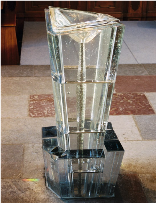
Dopfund av kristall. © LISS ERIKSSON/BUS 2008

ett altare av grå marmor. Intill detta står en kakelugn i blått och vitt. Rummet har tre pardörrar med fyllningar, varav de i norr har något svängda dörrblad för att passa i den svängda väggen. I taket hänger en ljuskrona av mässing som skänktes 1680 till S:t Olofs kapell.