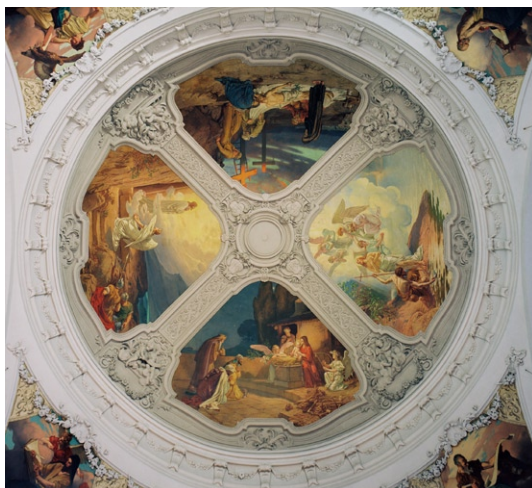
Kupolen med målningar av Julius Kronberg.

I kyrkorummets norra, södra och västra korsarmar finns läktare, på den västra står kyrkans orgel. Golvet i kyrkorummet är av kalksten förutom i bänkkvarteren som har obehandlade brädgolv. Väggarna är putsade och målade i ljusgrått. I rundbågiga fönsternischer sitter fönster