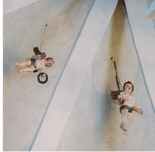
Två av de åtta passionsänglarna i rundhuset.

Bromma kyrkas äldsta del är en rundkyrka med anknytning till Stockholms äldsta historia. Kyrkan hade ursprungligen både kyrko- och för-