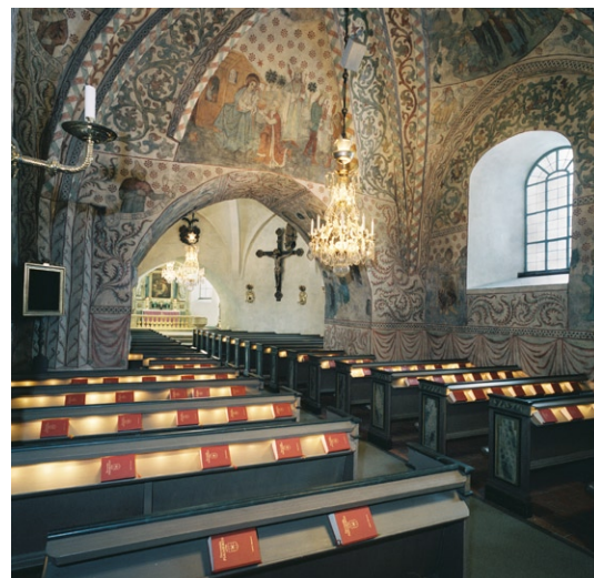
Långhuset mot rundhuset.