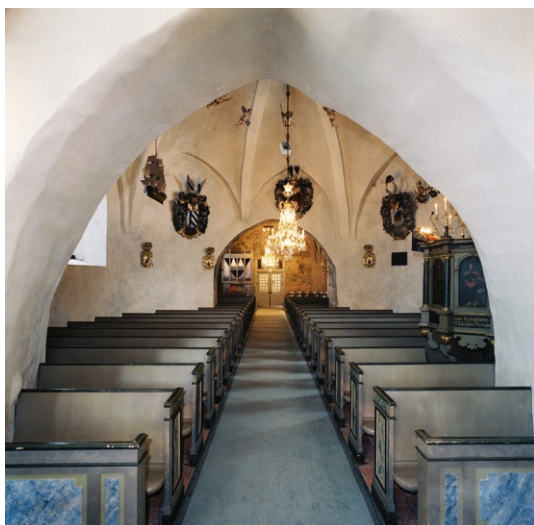
Från valvet mellan kor och rundhus mot långhuset . Predikstolen skymtar till höger.

Från den f d sakristian leder tio branta trappsteg i kalksten upp till övre delen av Hjärnes gravkor . Väggarna är putsade och vitmålade, i norr tresidigt avslutade. En kraftigt profilerad taklist markerar början på taket med sitt kupolliknande valv. I öster och väster sitter rundbågiga fönster. Altaret i norr har en av tegel murad nedre del, täckt av kalksten och ett högre parti av trä. Över altaret hänger ett bemålat träkrucifix från 1700-talets början. En i trä skulpterad