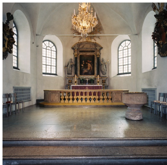
Koret med dopfont till höger.