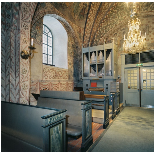
Långhuset med orgel.

I rundhuset är bänkarna utformade som i långhuset . Väggarna är putsade och vitmålade liksom det ribbvälvda kupolvalvet . Rummet har två fönster, ett i söder och ett i norr. Predikstolen, placerad norr om mittgången, är av trä och