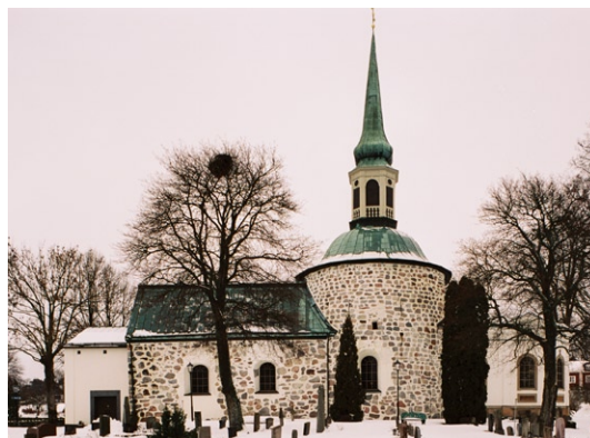
Exteriör från söder.

Bromma kyrkas olika byggnadsdelar är från olika tider och skiljer sig tydligt åt arkitektoniskt. Rundhuset och det yngre långhuset i väster är murade i gråsten med mycket breda, vit-