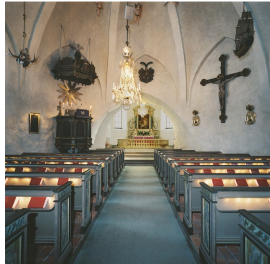
Rundhuset mot koret.

Längst i väster står en gråmålad orgel från 1957 med 17 stämmor, byggd av Marcussen & Søn, Aabenraa, Danmark. Intill orgeln står ett piano. Framför orgeln, på båda sidor om mitt-