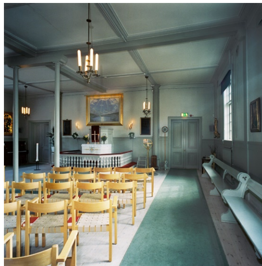
Kyrkorummet med entrén till sakristian till vänster och sydöstra entrén till höger.

Nattvardssilvret, kalk och patén , är från 1772 och signerat Åkerman. Det har tidigare tillhört