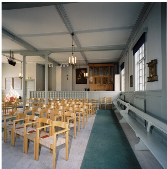
Kyrkorummet mot nordväst med bl a orgeln.

Åkerman & Lund 1958. Podiets barriär har balusterdockor som altarringens men något kraftigare. Några av de äldre kyrkbänkarna står längs långsidornas väggar. I övrigt är den ursprungliga