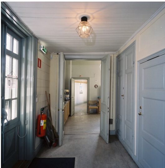
Förrummet/vapenhuset i sydost.

I norra delen av kyrkorummet står på ett podium en mindre orgel i ek, sidoplacerad mot öster. Orgeln har nio stämmor, tillverkad av