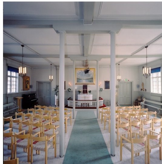
Kyrkorummet mot sydost.