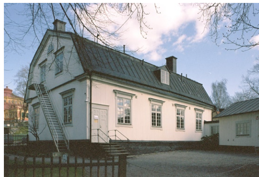
Exteriör från väster med den f d uthuslängan till höger.

Djurgårds kyrkan är uppförd som en profan byggnad och också utformad som en sådan. Endast korset uppe på frontespisen visar att det idag är en kyrkobyggnad. Kyrkan är enskippig och saknar kor . Kyrkorummet är orienterat i nordvästlig-sydostlig riktning med huvudentrén belägen på den sydöstra gaveln. Den i sydvästra hörnet belägna ursprungliga uthusbyggnaden är sekundärt hopbyggd med kyrkan med en smal länk. Kyrkans stomme är av timmer.