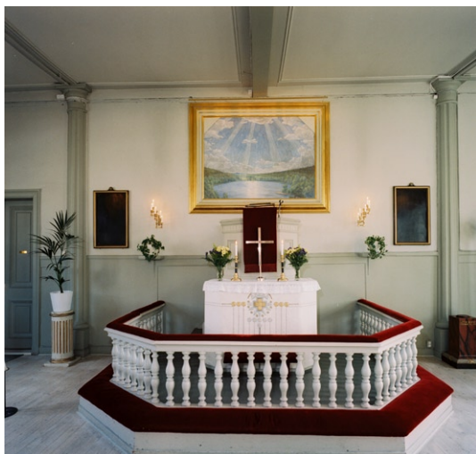
Kyrkorummet med altarpredikstol och målning av prins Eugen. Målning © PRINS EUGEN/BUS 2008

Åkerman & Lund 1958. Podiets barriär har balusterdockor som altarringens men något kraftigare. Några av de äldre kyrkbänkarna står längs långsidornas väggar. I övrigt är den ursprungliga