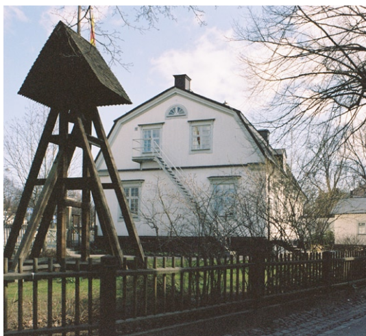
Exteriör från nordväst med klockstapeln.

Strax nordväst om kyrkan står Djurgårds kyrkans klockstapel. Den invigdes 1950, uppförd enligt arkitekten Ragnar Hjorths ritningar från 1948. Stapeln har en enkel, öppen träkonstruktion som upptill är prydd med en kyrktupp. Hjalmar Gullberg har skrivit den dikt som är ingraverad på kyrkklockan.