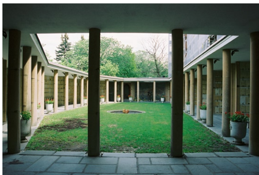
Den övre urngården mot öster i kolumbariets äldsta del.

öppen gård, omgiven av en kolonnad i gulvit marmor. Totalt fjorton rum med urnnischer med täckplattor i samma material öppnar sig mot gården, som utgörs av en gräsmatta med en liten damm. Östra delen har en absid formad avslutning med en freskmålning med motivet Den gode herden av Arvid Fougstedt (1888-1949) från 1942. Mot söder står ett stenaltare med en relief av konstnären Ture Jörgensson från 1939. Taklampetterna i form av blomkalkar är av brons.