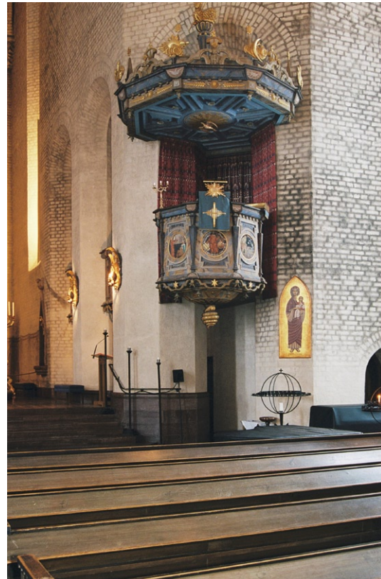
Kyrkorummet med predikstolen.

Gunnar Torhamn. I norr finns ett litet altare och mitt på kapellets golv står dopfunten av sandsten som kan vara från 1500-talet. Kapellet, som är försett med lösa sekundära stolar, är förbundet med både kolet och långhuset via trappor och höga arkadöppningar. I öppningarna mot kyrkorummet finns dekorativa grindar och räcken av smidesjärn, utförda av Herman Lindblom efter Tengboms ritningar. Intill öppningen mellan kapellet och kolet finns en freskmålning med motivet Veronikas svetteduk av Olle Hjortzberg från 1923.