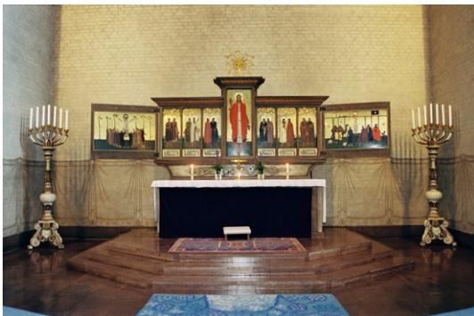
Koret med altare, altarskåp och sjuarmade ljusstakar.

I norra tornets nedersta del ligger dopkapellet, några steg lägre än långhuset . Rummet har en åttkantig planform och är belyst uppifrån. Väggar och valv är täckta med målningar av