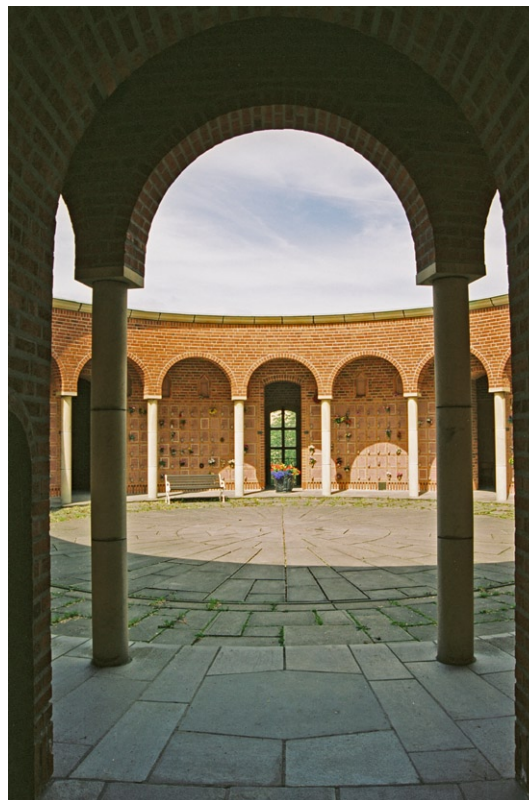
Den nedre urngården mot norr i kolumbariets yngre del.

Högalidskyrkan betraktas som ett av Sveriges främsta exempel på nationalromantik och kan ses som en av det svenska 1900-talets stora katedraler . Med sina två östtorn och mäktiga tegelgavlar associerar Högalidskyrkan till äldre svensk kyrkoarkitektur, som t ex Visby domkyrka. Även interiören med de höga kryss- och stjärnvalven och fasta inredning som representerar olika konststilar, t ex altarskåpet med sin tydliga medeltida inspiration och predikstolens barocka former, knyter an till ett äldre traditionsrikt kyrkobyggande. Kyrkan räknas till ett av arkitekten Ivar Tengboms yppersta verk.