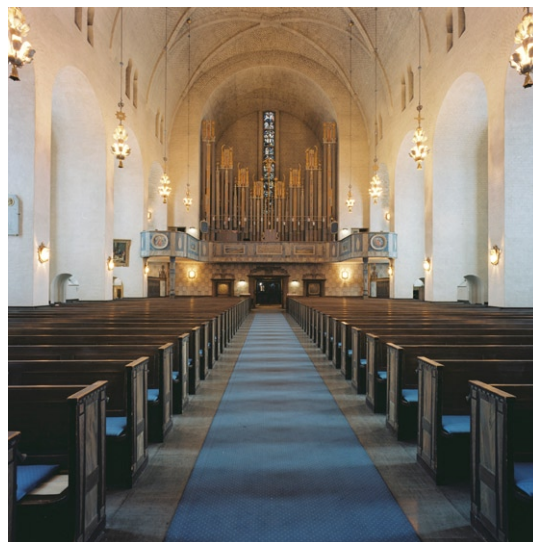
Kyrkorummet mot orgelläktaren i väster.

Bakom orgeln finns en glasmålning med motiv ur Bergspredikan , också komponerad av Brandtberg. Läktaren har bänkinredning som kyrkorummet i övrigt. Under läktarens utsvängda delar finns i norr och söder dekorativt utformade genombrutna träskrank, bakom vil-