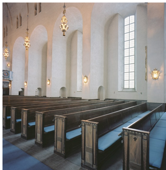
Kyrkorummet med bänkinredning mot nordväst.

Koret ligger åtta trappsteg högre än långhuset. Korets valv har formen av ett stjärnvalv och väggarna är nedtill försedda med en draperimål-