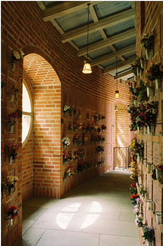
Den runda omgången i kolumbariets yngre del.

Med sitt läge högt uppe på Högalidsberget och sina tvillingtorn är Högalidskyrkan en viktig del av Stockholms och Södermalms siluett och kan ses som en pendang till det samtida Stads- huset på andra sidan Riddarfjärden. Kyrko- byggnaden bildar tillsammans med det sam- stämt utformade församlingshuset och präst- gården ett i form och färg samlat rum där även kastanjeallén spelar en viktig roll. Med undan- tag för några murar övergår kyrkotomten i Högalidsparken utan några synliga avgräns- ningar. Kyrkans exteriör ger ett mäktigt in- tryck med sina stora tegelytor, branta takfall och skulpterade stenportaler i renässansform i väster.