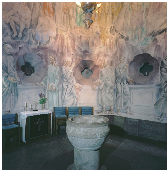
Dopkapellet med målningar av Gunnar Torhamn. © GUNNAR TORHAMN/BUS 2008

lösa stolar på tvären, en flygel samt, mot det norra sidoskeppet, kororgeln som är målad i blått, rött och guld. Den är byggd av Mads Kjersgaard, Uppsala, 1984 och har 17 stämmor. Det finns även plats för ett flyttbart altare och dito dopfunt m m.