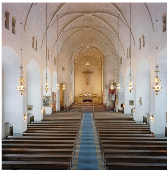
Kyrkorummet mot koret i öster.

Kyrkorummets mittskepp är täckt av höga kryssvalv med en fri spännvidd på drygt 15 meter. Valvens tryck tas upp av breda vinkelställda konterforer , vilka bildar djupa nischer kring de höga smala fönstren, som är försedda med blyinfattade små rutor av antikglas. Genom att konterforerna i sin tur är genombrutna av låga rundbågiga öppningar bildas smala sidoskepp/sidogångar i norr och söder. Med fönstrens placering djupt inne i fönsternischerna är ljuskällorna för det mesta dolda för besökaren vilket ger en speciell och suggestiv ljusföring i rummet. I den södra sidogången är Tengbom för övrigt begravd i en nisch. Nischen är täckt med en stenplatta med Tengboms porträtt i profil och texten ”Denna helgedom som han skapat blev hans sista vilorum” samt ”När tungan tystnat tala stenarna”.