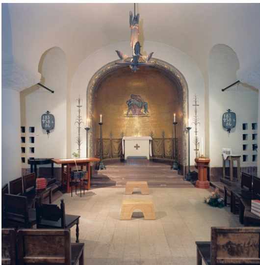
S:t Ansgarskapellet mot ko ret.

S:t Ansgarskapellet, som är inrymt i öster under koret, byggdes som gravkapell men nyttjas idag för alla typer av förrättningar. Det utgörs av ett treskeppigt litet rum med absid i väster. Det tunnvalvda taket bärs upp av kraftiga kolonner med kapital med skulpterad dekor av ignabergakalksten. Samma stensort finns i altaret. Absidens valv och väggar är täckta av en guldmosaik med Pietàmotiv , utfört av Einar Forseth. Väggar och valv i övrigt är vitslammade, kring entrén i öster och absiden i väster försedda med dekorativt måleri och textband. Golvet är av kalksten. Armaturerna i form av ljuskronor med skulpterade figurer i trä och mässing samt ljusarmar i koppar är ursprungliga. De brunlaserade stolarna är också från byggnadstiden. Det fristående altarbordet och dopfunten är liksom vindfånget sekundära.