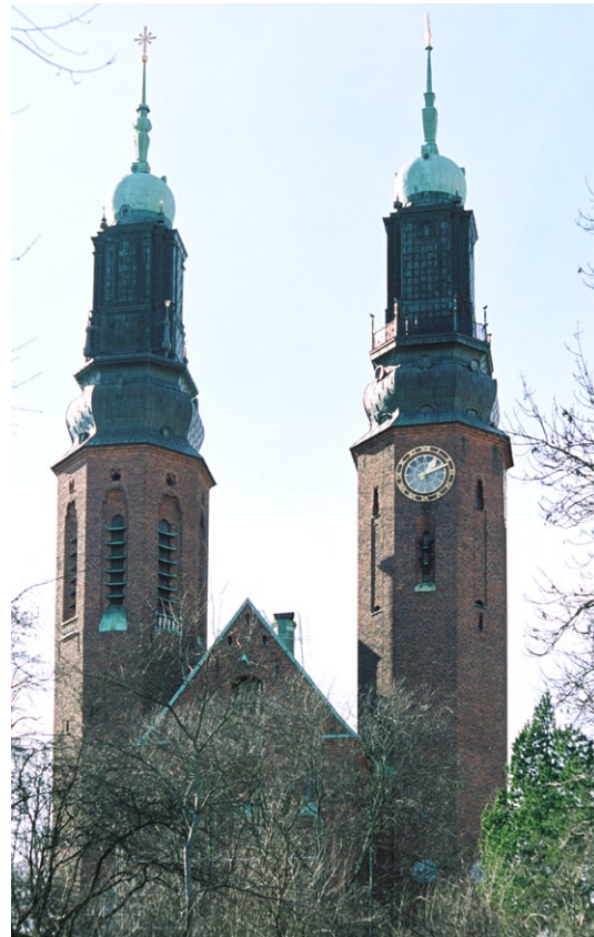
Exteriör med de två tornen från öster.

Långhusets branta sadeltak är belagt med kopparplåt liksom pulpettaken över de något lägre smala sidoskeppen. De två tornen har båda en åttkantig planform och klockformiga kupoler klädda med koppar. De är snarlika i sin utformning men skiljer sig dock i detaljer som fönstersättning och fönsterformer, ljudöppningar, balustrader m m. Det norra tornet kröns av en förgylld tupp medan det södra kröns av ett