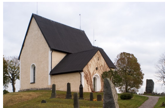
Exteriör från sydväst.

Kyrkan har branta sadeltak med undantag för absidens tak som har en halvkonisk form. Sedan 1887 täcks taken av korrugerad plåt. Dessförinnan bestod takmaterialet av tjärade spån. Kyrkans ingång genom vapenhuset är försedd med en rundbågig, flersprångig om-