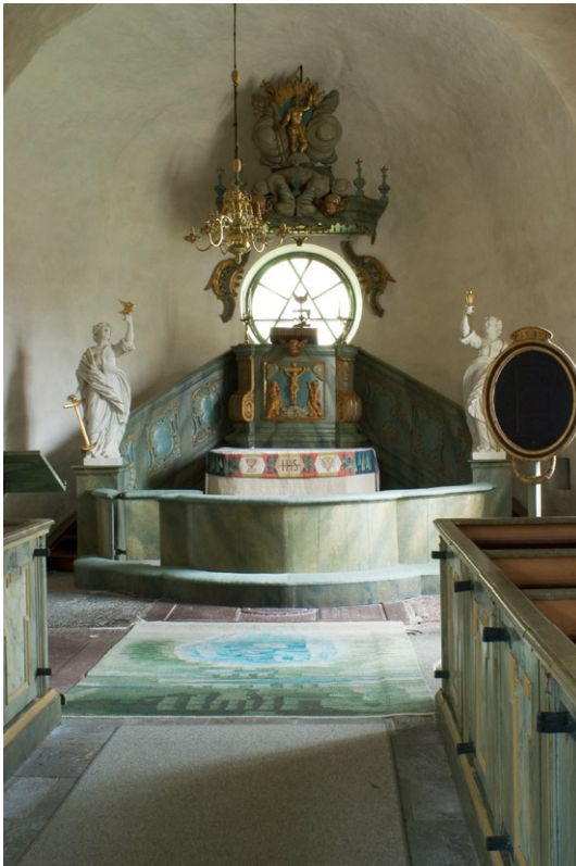
Korabsiden med altarpredikstolen från 1758–59 tillverkad av bildhuggaren Magnus Granlund .