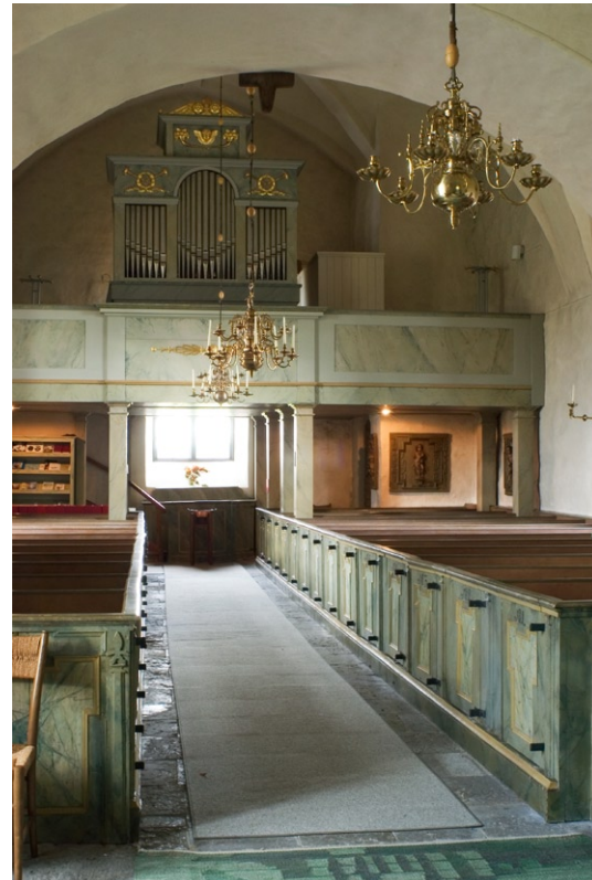
Interiör mot väst.

slagna i samband med uppförandet under senmedeltid. Golvet är lagt med tegel. Ingången är rundbågig med en granitbåge. Dörren är av bräddor och pryds av beslag och en vriden dörring av järn av senmedeltida ursprung.