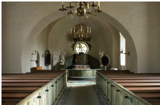
Interiör mot öst.

Koret täcks av ett tunnvalv och absiden av ett hjälmvalv slagna under romansk tid. Långhuset är välvt med två kryssvalv , sexdelade ribbvalv , med djupa kappor, slagna av tegel under senmedeltid. Innan valvslagningen bar långhuset ett platt trätak, vilket framgår av spår på den gamla takstolen, synlig ovan valven. Väggar och valv i långhuset , kor och absid är vitputsade. Golvet i långhuset är lagt med kvadratisk plansten förutom i bänkkvarteren som är lagt med brädgolv. Koret är lagt med kalkstenshällar från 1600- och 1700-talen. Under 1400-talet målades interiören med kalkmålningar som troligen överkalkades under 1700-talet. Åter framtagna målningar är bevarade i större omfattning endast i