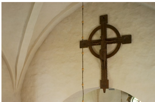
Triumfkrucifixet från 1200-talet.

skranket motsvaras på andra sidan kyrkorummet av en klockarbänk med svängd skärm och är samtida med altarpredikstolen. Bänkinredning är sluten och härrör från 1726, men består delvis av äldre bänkar.