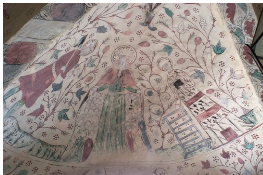
Kalkmålningar i vapenhuset från 1400-talets mitt.

vapenhuset. I övrigt har fragment återfunnits men överkalkats.