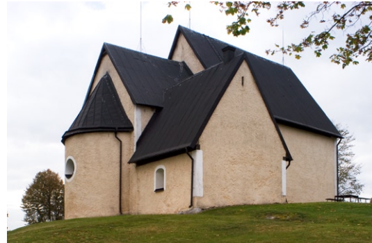
Exteriör från nordöst.

Kyrkan är utvändigt spritputsad och avfärgad i en ljusgul kulör med vita slätputsade hörn och omfattningar. Runt långhus, kor och absid lö-