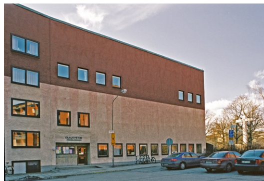
Exteriör från öster.

Byggnadens fasad är spritputsad i två kulörer. De tre nedersta våningarna är vitmålade medan de övre har en mättad mörkröd färg. Även husets kortsidor är rödfärgade. De ospröjsade fönsterbågarna är av teak. Mot sydväst har fasaden indragna balkonger. På fasaden mot Armfeltsgatan sitter trapphusfönstren förskjutna i förhållande till lägenhetsfönstrens rader. Den del av fasaden som rymmer kyrkan och försam-