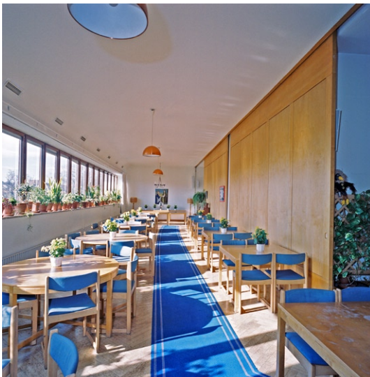
Församlingssal över kyrkorummet.

Olaus Petri kyrka utgör en del av ett flerbostadshus, vilket är ovanligt inom Svenska kyrkan. Fasaderna har en okonventionell form och färgsättning, både som bostadshus men framförallt som kyrka med sin lätt svängda fasad, oregelbundna fönstersättning och tvåfärgade puts. Den fristående klockstapeln och det vitmålade betongkorset markerar byggnadens kyrkliga funktion.