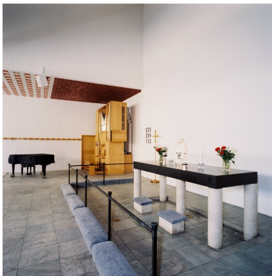
Koret med altarring och altare. I fonden står orgeln.

kortväggarna sitter väggarmaturer av björk längs en horisontell bräda med vinklade skärmar. I korpartiets bakre del hänger en lådlik armatur av björk på järnkonsoler. Förutom takmålningar, karmstolar, textilier och silver är alla ur-