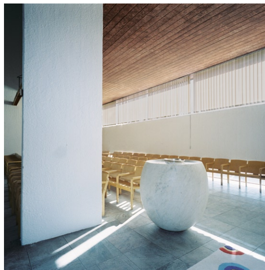
Kyrkorummet med dopfont.

sprungliga inventarier och fast inredning utformade av Peter Celsing.