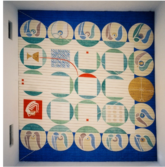
Takmålning i kyrkorummet av Olle Nyman.

mets enda fönsteröppningar sitter i den sydvästra långväggen. Två fönsterband med tunna teakkarmar sträcker sig längs hela väggen, ett brett under taket och ett smalare nere vid golvet. Öppningarna ger rummet mycket ljus men avskärmar samtidigt rummet från omgivningen med hjälp av den speciella placeringen. Utsikten begränsas till himmelen med trädkronor och den gräsbevuxna marken utanför.