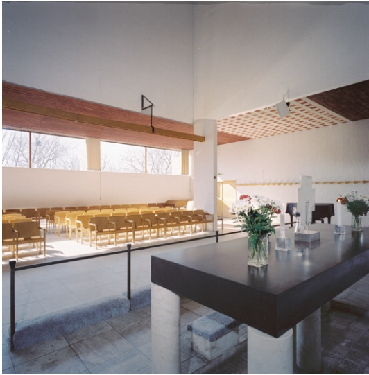
Kyrkorummet från koret med altaret i förgrunden.