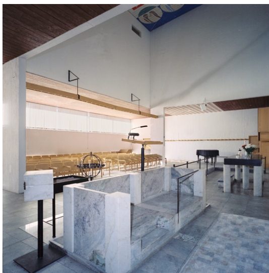
Koret med predikstol och altare till höger.

kortväggarna sitter väggarmaturer av björk längs en horisontell bräda med vinklade skärmar. I korpartiets bakre del hänger en lådlik armatur av björk på järnkonsoler. Förutom takmålningar, karmstolar, textilier och silver är alla ur-