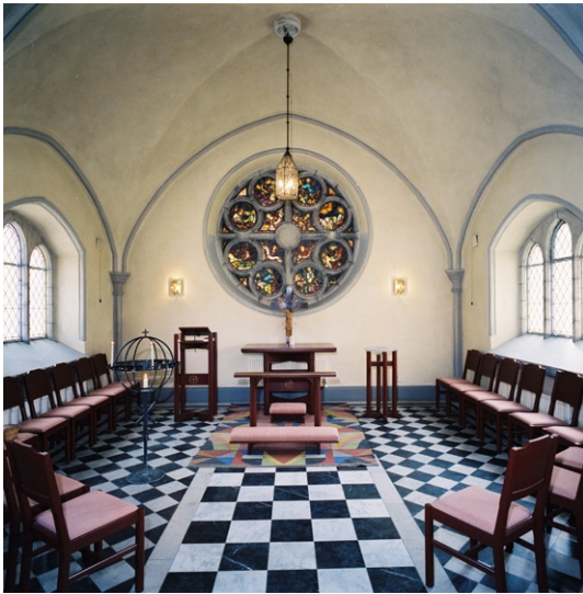
Oscars Lillkyrka, interiör.