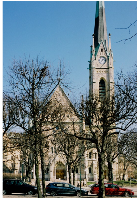
Exteriör från väster.

I fasaden förekommer en rad för gotiken och nygotiken typiska drag som strävpelare , fialer , höga spetsbågiga masverksfönster , vattenkastare i form av långhalsade odjur samt portaler med skulpterade tympanon. I västfasaden markeras huvudentrén med en hög portal med tympanonfält med de fyra evangelistsymbolerna i vit italiensk marmor, däröver ett stort rosettfönster . Portalerna och en del fönster flankeras av kolonner av polerad rödsvart granit från Vånevik i Småland. Portarna av lackad ek har stora dekorativa svarta smidesbeslag. Högt upp i det fyrkantiga tornet finns höga spetsbågeformade