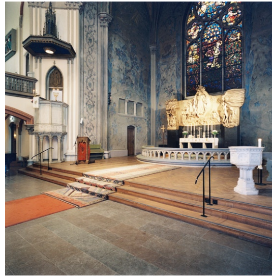
Koret med dopfunt och läspulpet samt predikstolen.

gelfirman Marcussen & Søn i Aabenraa och har 78 stämmor. Orgelfasaden av obehandlad ek med delvis förgyllda detaljer är utförd av arkitekten Bernhard Schill. Mellan orgeln och södra respektive norra läktarna står höga delvis genombrutna träskärmar med masverk i gotisk stil , tillkomna vid Wahlmans renovering. Orgeln döljer delvis västfasadens stora rosettfönster, som är det enda återstående av de ursprungliga glasmålningarna utförda av glasmålarfirman Neumann & Vogel i Stockholm.