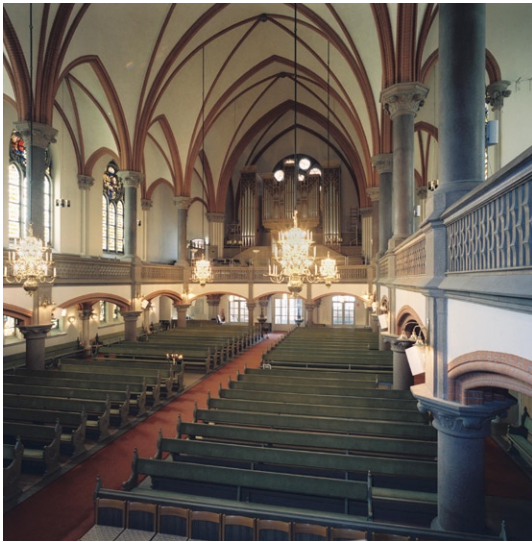
Kyrkorummet mot väster och orgelläktaren.