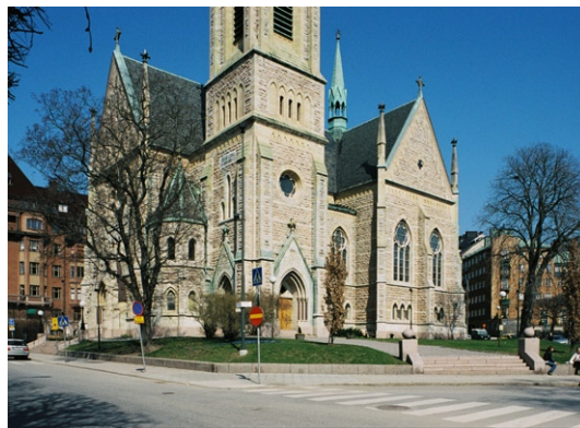
Exteriör från söder.