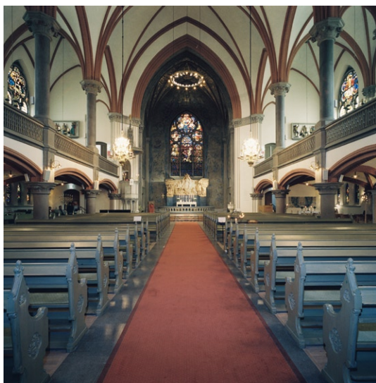
Kyrkorummet mot koret .

Tre glasade dörrar leder in i långhuset , under orgelläktaren. Mittskeppet är mycket brett med höga kryssvalv . De låga och smala sidoskeppen, som fungerar som gångar, övergår österut i två breda och ganska grunda korsarmar. Runt mitt-