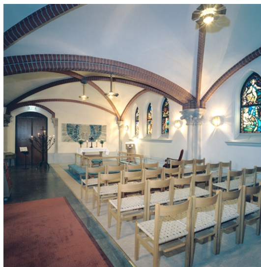
Den gode herdens kapell i södra korsarmen.

Sakristian är belägen norr om koret och avslutas i norr med en liten absid med ett altare. Taket är välvt och liksom väggarna putsade och målade i brutet vitt, golvet är belagt med bräder. Fönstren är blyspröjsade med tonat rött och grönt glas. Söder om koret finns ”silverkammaren” och i källaren under koret finns en textil-