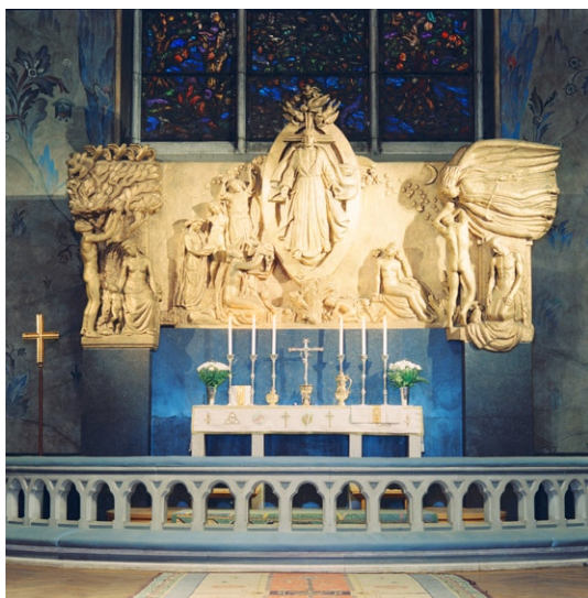
Koret med altarpupsats, al secco-målning och Vigelands fönster.

geln fjällverk över kyrkvinden. Korgolvet, liksom trappan upp till koret, är belagt med par-kettgolv.