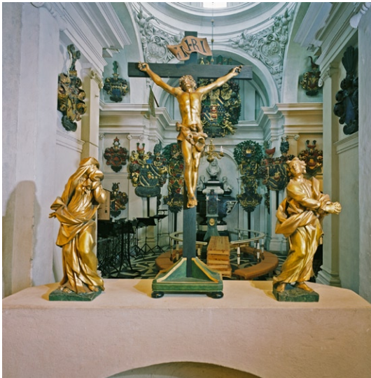
Förgyllda skulpturer, troligen av Burchardt Precht. I fonden Bondeska gravkoret.