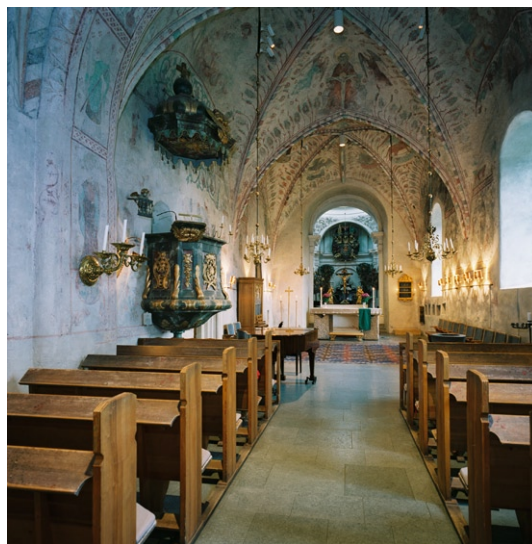
Kyrkorummet mot koret med predikstolen till vänster.

muren står ett krucifix flankerat av förgyllda träskulpturer, troligen gjorda av Burchardt Precht på 1690-talet medan krucifixet är en gipskopia. Altarringen med smala balusterdockor är samtida med altaret liksom korstolarna utmed söderväggen.