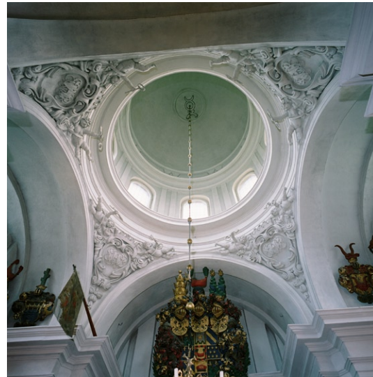
Kupolen i Bondeska gravkoret.

ljudtak över. Intill predikstolen står en flygel och i söder en dopfunt av sandsten från 1943. I taket hänger fyra malmkronor och på väggarna sitter lampetter i mässing och koppar på skenor av smidesjärn. I norr leder en rundbågig dörröppning till sakristian och en spetsbågig till det tillbygga skrudhuset.