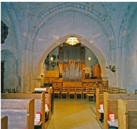
Kyrkorummet mot orgeln i väster