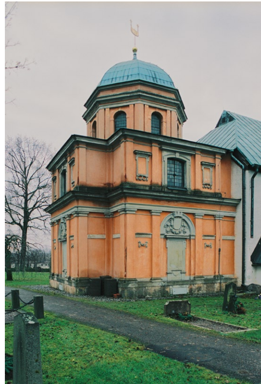
Bondeska gravkoret s exteriör från nordost.

Vapenhuset nås via en bräddörr med smidesbeslag och stocklås . I kalkstensgolvet ligger två gravhällar av kalksten. Väggarna är putsade och målade och har fragment av figurativa kalkmålningar. Kryssvalvets kalkmålningar är troligen från 1400-talet men påmålade 1905. Kyrkans äldsta gravstenar, tre stycken med runskrift från 1100-talet, står i vapenhuset . Nischer finns i