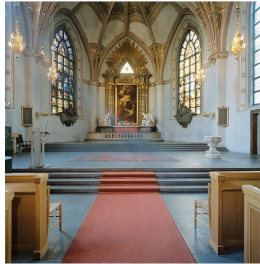
Kyrkorummet med dopfunt till höger och koret i fonden.

På var sida om altaret, som är av brun och grön kalksten, står knäböjande änglar skulpte-