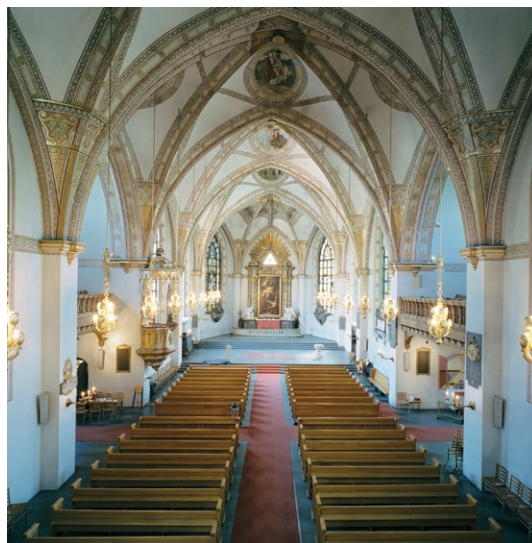
Kyrkorummet från orgelläktaren mot koret .

Kyrkorummet är enskeppigt med läktarförsedda tvärskepp. I väster finns en orgelläktare. Korets norra och södra väggar är snedställda in mot den rakt avslutande östra väggen. Sju stora spetsbågiga fönster ger ett ljust rum. Längst i väster är golvnivån några trappsteg högre än långhuset i övrigt. Den västra väggen är boaserad liksom vapenhuset med snidad dekor och intarsia på dörrarna. Liksom vapenhuset har kyrkorummet kalkstensgolv. Mittgången är belagd med en röd textilmatta. Väggarna är vitmålade med viss dekormålning i rött, gult och svart av Olle Hjortzberg (1872–1959). Fem kryssvalv täcker långhuset , tvärskeppen har ett kryssvalv vardera. Valvens ribbor, sköld- och gördelbågar har samma typ av dekormåleri som väggarna. I