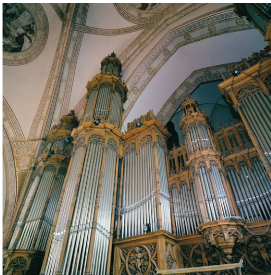
Detalj av orgelfasaden.

Hjortzberg. Ovanför alla läktarna sitter runda fönster. Orgeln i väster är tillverkad 1907 av Åkerman & Lund och har numera 58 stämmor.