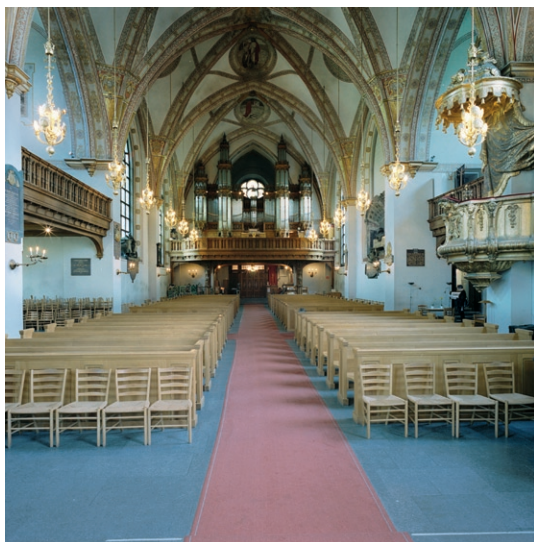
Kyrkorummet mot orgelläktaren med predikstolen till höger.

Hjortzberg. Ovanför alla läktarna sitter runda fönster. Orgeln i väster är tillverkad 1907 av Åkerman & Lund och har numera 58 stämmor.