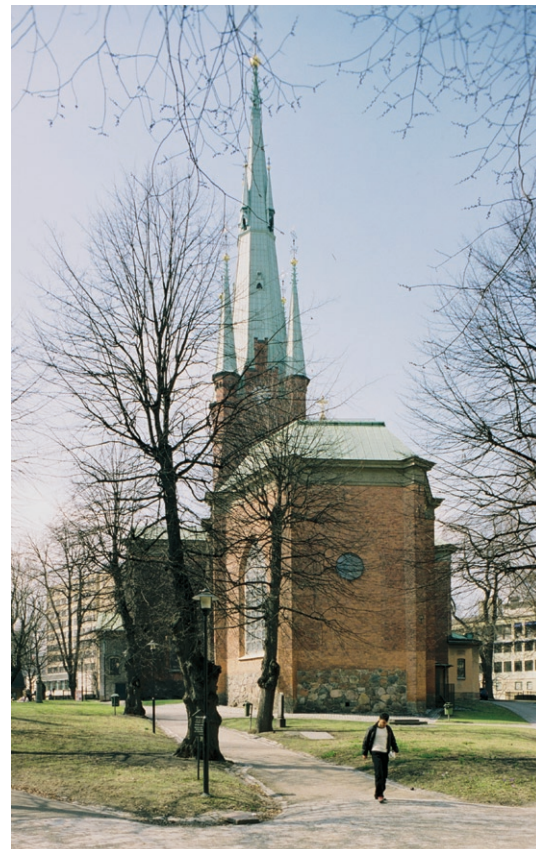
Exteriör från öster.

I exteriören skiljer sig långhus och torn markant åt arkitektoniskt. Långhusets oputsade stortegel