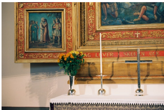
Detalj av altarskåp med målningar av Einar Forseth. © EINAR FORSETH/BUS 2008

En ekbladsdekorerad sandstenskolonn står mitt i den breda öppning som förbinder kyrkorummet med Herdens kapell. Här är väggarna också kalkade medan golvet är klätt med linoleum. Taket är panelklätt och spegelvälv, laserat i rödbrunt med dekormåleri i form av bl a textband. Rummet används numera för förvaring av textilier och som förråd men framförallt för kyrkkaffé och samvaro kring fyra runda bord