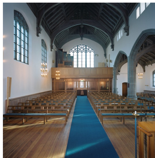
Kyrkorummet mot söder och orgelläktaren.