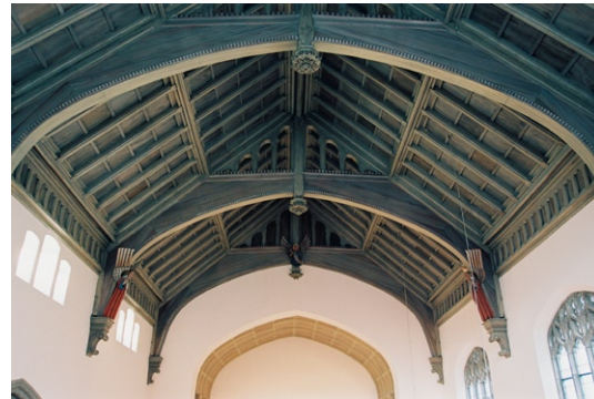
Huvudskeppets öppna takstolskonstruktion mot koret.

Huvudskepp och sidoskepp förenas av en arkad med tre spetsbågar som vilar på kraftiga sandstenspelare. Merparten fönster har masverk av sten, är blyspröjsade och försedda med klart sk katedralglas med inslag av färgat glas. Orgelläktaren i söder med sin barriär av ek har en sidoställd Åkerman & Lund-orgel från 1960 med 19 stämmor. Den öppna bänkinredningen i ek