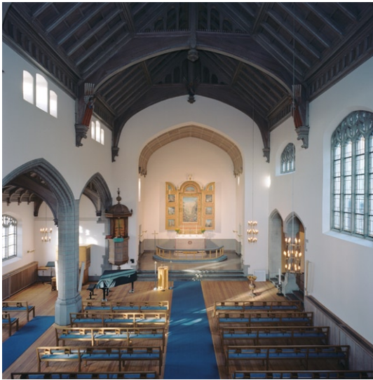
Kyrkorummet mot norr och koret från orgelläktaren.

mörk och trång p g a den låga takhöjden och det mörkbetsade kassettaket.