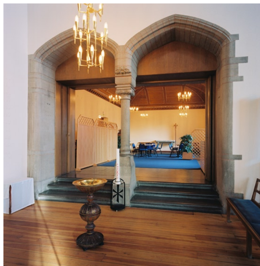
Vy mot Herdens kapell med dopfunten i förgrunden.

med plats för uppemot 20 personer. Några äldre stolar står uppradade kring väggarna och mitt på östväggen sitter en altarskiva i sten kvar sedan rummet användes som kapell. En sekundär vikvägg kan skilja de två rummen åt. Sakristian , som numera har sin placering strax öster om koret , har en mycket enkel utformning med trägolv och vitmålade väggar och tak, helt utan dekor. Längs med ena långväggen finns platsbyggda skåp för antependier m m.