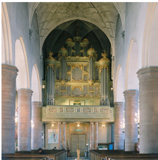
Kyrkorummet mot väster och orgelläktaren.