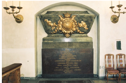
Gravmonument över Teodor Ankarcrona i nisch i korsets södra vägg.

En av kyrkans korkåpor och ett antependium i brokad med silverspetsar är från 1657. De, och