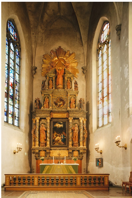
Koret med 1930-talets altaruppsats.

musslan som motiv, S:t Jacobs attribut. Muselmotivet återkommer i de många armaturer som tillkom vid 1930-talets ombyggnad, både i dem på läktarens undersida samt i kyrkorummets takkronor och vägglampetter.