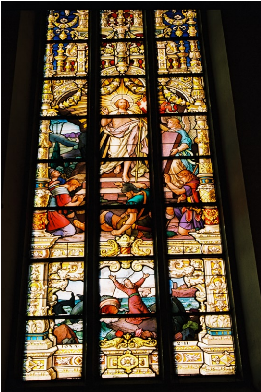
En av korsets glasmålningar, motiv Jesu uppståndelse.

bekostnad av flera bänkrader, ett förråd som byggts upp till fönsterhöjd.