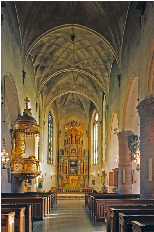
Kyrkorummet mot koret i öster.

na inslag. I bänkkvarteren är golven belagda med grå linoleum. Långhusets fönster är spetsbågiga av smidesjärn, blyspröjsade med antikglas.