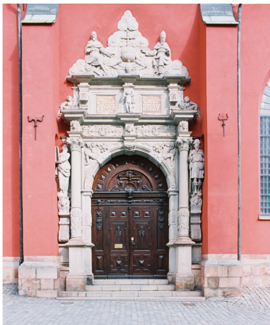
Den rikt skulpterade sydportalen.

lör med takfotslist, hörnkedjor m m i vitt. Det något högre mittskeppet kröns av ett firsidigt torn med kopparklädda ljudluckor. Över denna reser sig en på fyra sidor välvd huv i koppar med urtavlor i samtliga väderstreck och skulptural och delvis förgyllt utsmyckning i form av urnor, facklor m m. Huvu kröns i sin tur av en kopparklädd lanternin med oval plan och ett svart smidesräcke. Tornet avslutas uppåt med ett förgyllt klot med kors. Huvudentrén i väster flankeras av två smala åttkantiga torn, krönta av klot och stjärnor. Här och var i fasaden finns ankarlutar av olika typer. Sidoskeppens och korets fasader är försedda med kraftiga strävpelare . På nordfasaden är flera minnestavlor uppsatta, bl a för diktaren Johan Henrik Kellgren och den franske målaren Guillaume Taraval. I nordost, i anslutning till koret , är en envåning sakristia utbyggd. Såväl de något lägre sidoskeppens som