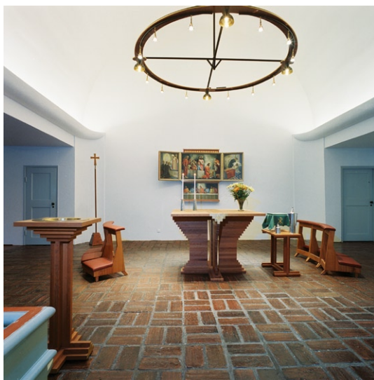
Koret efter renoveringen 2006 med nytt altare, dopfunt, kredensbord, knäfall och ljusring.

är signerade Gunnar Torhamn (1894–1965) 1929. Dessa har senare kompletterats med luckor med målningar av samme konstnär. Pre-