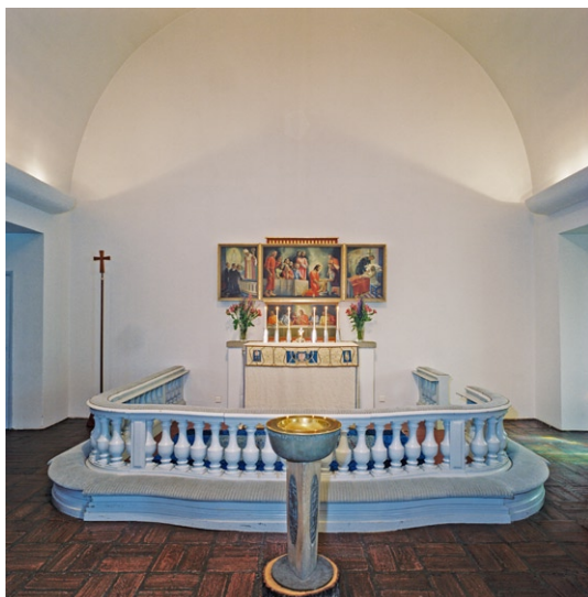
Koret med altarring, altartavla och altare m m före 2006 års renovering. Altartavla © GUNNAR TORHAMN/BUS 2008

är signerade Gunnar Torhamn (1894–1965) 1929. Dessa har senare kompletterats med luckor med målningar av samme konstnär. Pre-