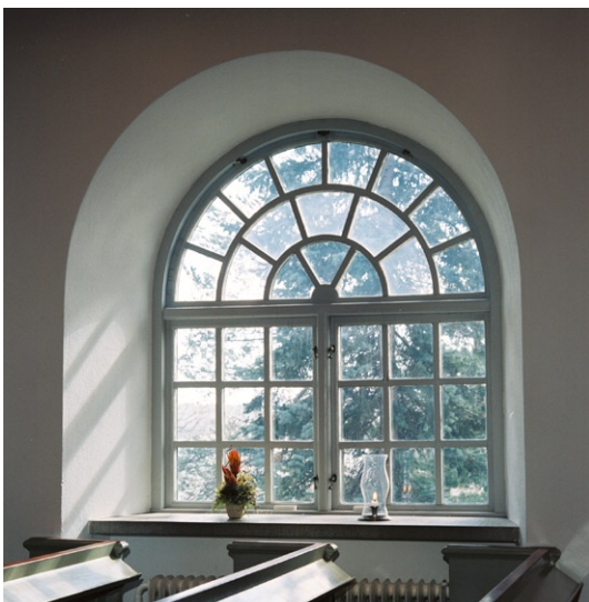
Fönster mot söder.

och rödmålat trägolv. Golvet i övrigt är belagt med stortegel som lackats. Fönsternischerna är djupa och rundbågade, försedda med småspröjsade gråmålade fönster med klarglas. Fönsterbänkarna är av räfflad kalksten. I väster finns orgelläktaren med sina fyra kraftiga runda träpelare som stöd. Orgeln, som är byggd av Grönlunds Orgelbyggeri 1961, har en enkelt utformad fasad och 27 stämmor. Belysningen i långhuset består av fyra ursprungliga ljuskronor i målat trä med nakna glödlampor samt i trätakets nedre del sekundära ljusramper. I valvet mellan långhus och kor hänger ett stort triumfkruccifix.