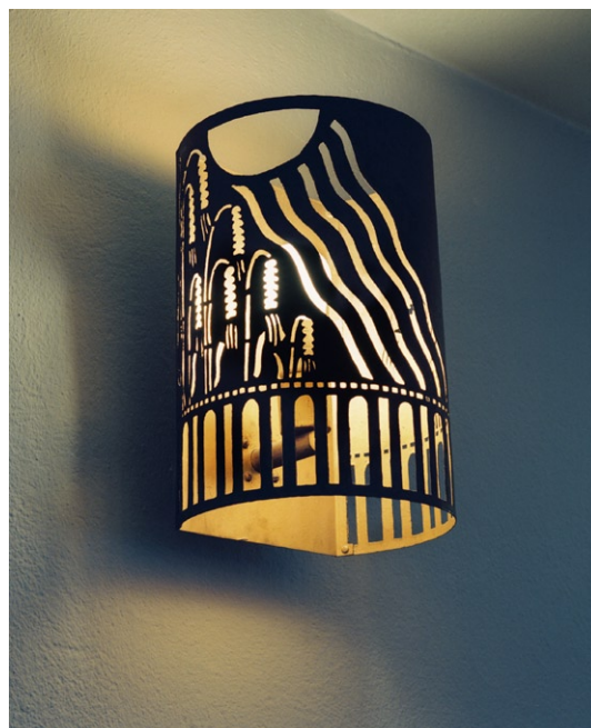
Lampett av koppar. © GUNNAR TORHAMN/BUS 2008

I korets södra vägg sitter ett runt fönster med en glasmålning från 1956, signerad Gunnar Torhamn, som även ritat lampetterna av koppar. Predikstol saknas numera men hade ursprungligen sin placering i korets sydvästra del, väl synlig både från långhuset och den norra korsarmen, som var avsedd för de epileptikerpatienter som vårdades inom området. I korsarmen är numera den fasta bänkinredningen