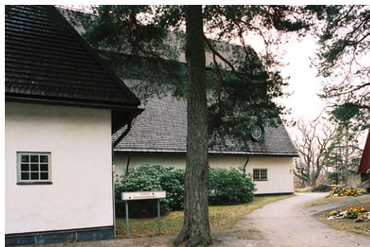
Exteriör från norr.

Kyrkans fasader är slätputsade och avfärgade i vitt ovan en sockel klädd med svarta skifferplattor.