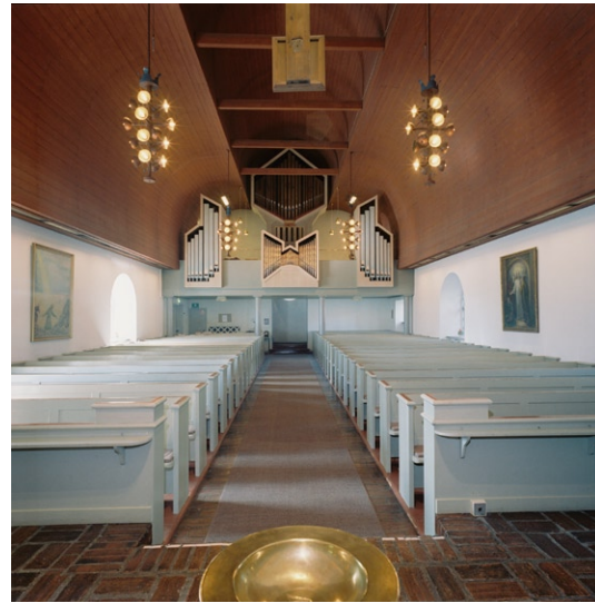
Kyrkorummet mot orgelläktaren.

Långhusets tak är klöverbladsformat, klätt med längsgående falurödfärgad slätpanel i trä. Väggarna är slätputsade och vitmålade. På ömse sidor om mittgången finns två öppna bänkkvarter med bänkar målade i grått med röda detaljer