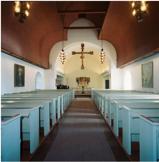
Kyrkorummet mot koret.