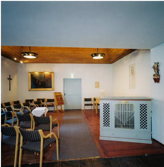
Norra korsarmen med kororgel.

borttagen. Lösa stolar, ett modernt träaltare, en flygel, kororgel och den ursprungliga dopfunten samsas här om utrymmet. Väggarna är putsade och vitmålade. Golvet är av trä liksom taket, som är försett med två ursprungliga takarmaturer.