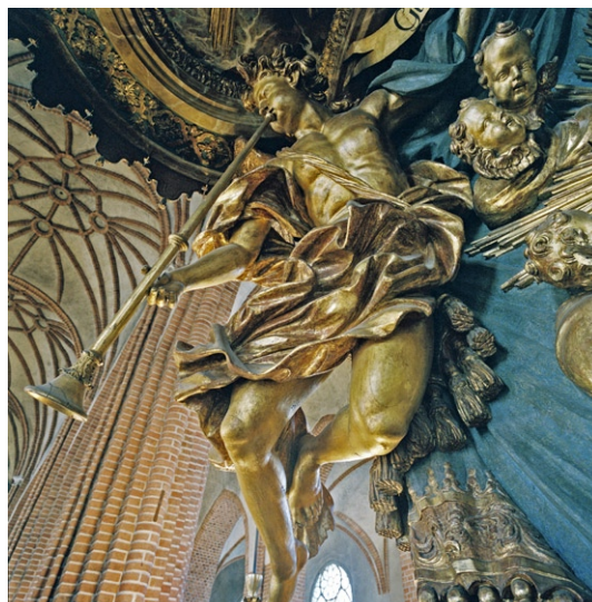
Skulpterad ängel på predikstolen.