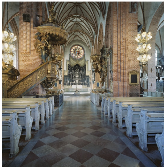
Kyrkorummet mot koret med predikstolen till vänster.

Kyrkorummet har ett rutlagt kalkstengolv i grått och rött. I bänkkvarteren ligger brädgolv och i den östra och nordvästra delen av kyrkan utgörs golvet av gravhällar. Väggarne är putsade och ljusst grå liksom stjärnvalven i mittskeppet och ribbvalven i sidoskeppen. Valvribborna och pelarna, varav flertalet är knippelare , har fri-