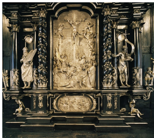
Detalj av silveraltarets mittparti.