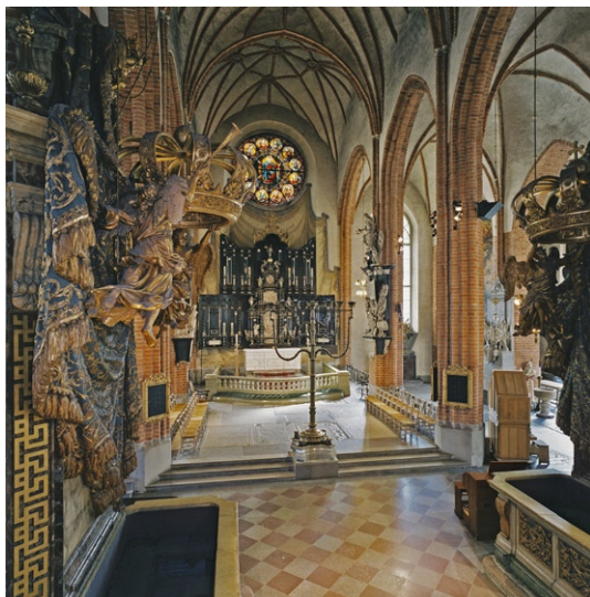
Kyrkorummet mot koret med kungsstolarna i förgrunden.