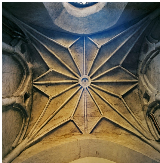
Stjärnvalv i rummet bakom orgelläktaren.

Bland Storkyrkans många mycket speciella inventarier kan här bara några enstaka exempel nämnas. Söder om koret hänger ett krucifix av ek på en pelare. Troligen är det gjort av Bernt Notke. En ljuskrona av silver med mycket rik dekor, även den söder om koret , skänktes till kyrkan 1674 vid Ebba Brahes begravning. Nära vindfånget i sydväst hänger Vädersonstavlan, den tidigaste avbildningen av Stockholm som man känner till. Originalmålningen gjordes på 1530-talet medan denna kopia målades 100 år