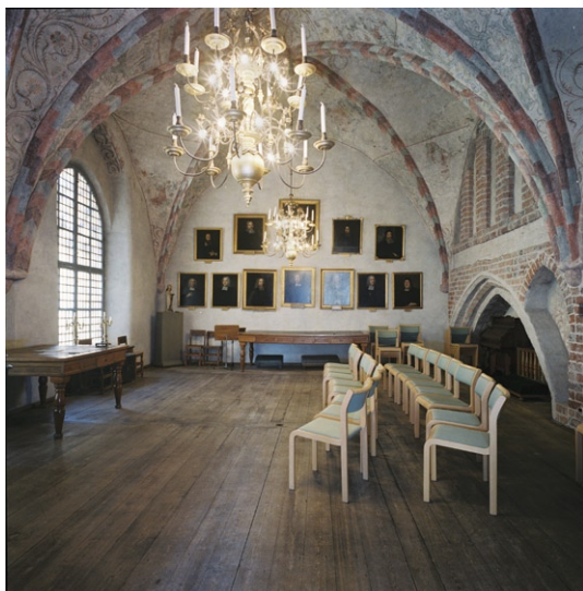
Rum 1 tr upp söder om tornet.

trappa leder härifrån upp till ett rum med två kryssvalv med kalkmålningar, figurativa och i dekorform. I den västra väggen finns vitputsade blindingar och målerifragment på vissa partier. I tornet, bakom orgelläktaren, ligger ett rum med ett högt stjärnvalvt tak och väggar vars övre delar i söder och norr är indelade i välvda nischer.