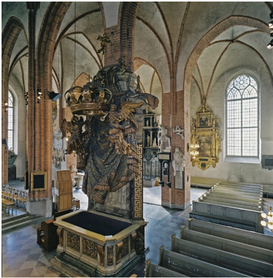
Kyrkorummet med den södra kungsstolen i förgrunden.

1340-talet då valven slogs. Fönstren i kyrkan är rundbågiga med innerbågar av trä med blyspröjsat antikglas. Glasmålningarna i fönstret i nordväst är gjorda av Einar Forseth (1892–1988). Bänkinredningen är målad i grågrönt och har snidade gavlar och fältindelade fronter. Armaturer av mässing med vita glaskupor i tre nivåer hänger från gördelbågarna mellan mittskeppet och de närmast angränsande skeppen. Liknande lampor, men mindre, hänger närmast koret och över sidoläktarna.