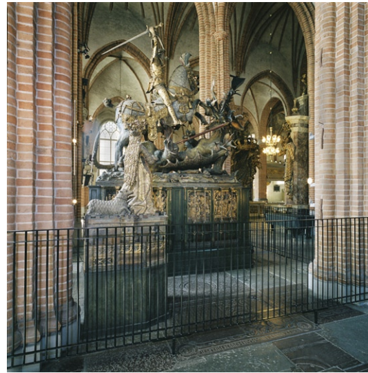
Skulpturgruppen S:t Göran och draken med prinsessan i förgrunden.

Mot pelarparet direkt öster om predikstolen står Kungsstolarna på var sin sida om mittgång-