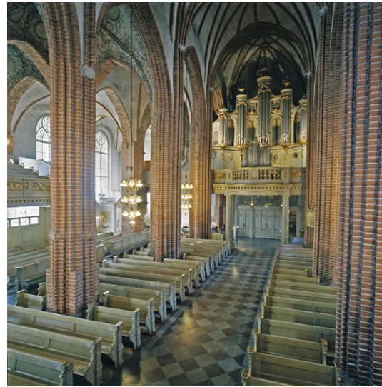
Kyrkorummet mot orgelläktaren.

Dagens önskan om ett mångfunktionellt rum medför inredning i form av lösa stolar i flera olika utföranden och tillfälliga installationer som förvaras i kyrkorummet.