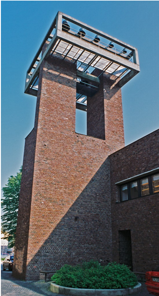
Exteriör från söder med klocktornet.

sad är bara en våning hög, eftersom marknivån är högre här. Större delen av fasaden täcks av ett fönsterband.