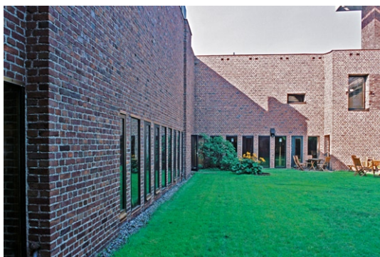
Den kringbyggda gården.