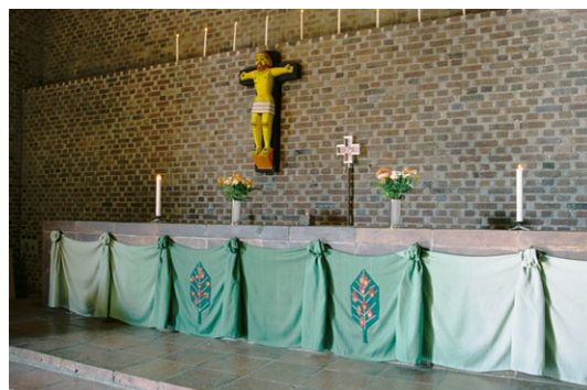
Koret med altare och krucifix av Bror Hjort. © BROR HJORT/BUS 2008

Alf Munthe (1892–1971), är draperat på järnringar. På korväggen , asymmetriskt i förhållande till altaret, sitter ett snidat krucifix av trä, målat i klara färger av konstnären Bror Hjort (1894–1968). Intill detta sitter ett litet likarmat silverkors, ritat av Peter Celsing. Korväggen har en avsats ovanför krucifixet där tolv elektrifierade ljus står. Under det smala fönstret i norr står en flygel. På den västra sidan av koret står predikstolen av svart smide och omålat trä.