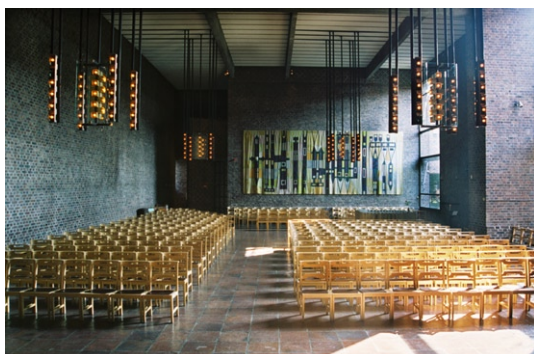
Kyrkorummet från koret .

Koret är något smalare än långhuset . Fem trappsteg leder upp till det mycket långa altaret. Det är uppmurat av tegel och klätt på fram- och ovasidan av tjocka keramiska plattor, liknande golvets. Antependiet , utformat av konstnären