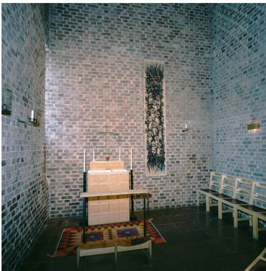
Kapell. Textil utsmyckning © KERSTIN EKENGREN/BUS 2008

Sakristian ligger utmed den kringbyggda gårdens västra sida. Golv och väggar är av tegel, taket av formgjuten betong. Ett altare av ek står intill fönstret vilket är placerat i en djup nisch med fönsterluckor av ek perforerade av hål. Till