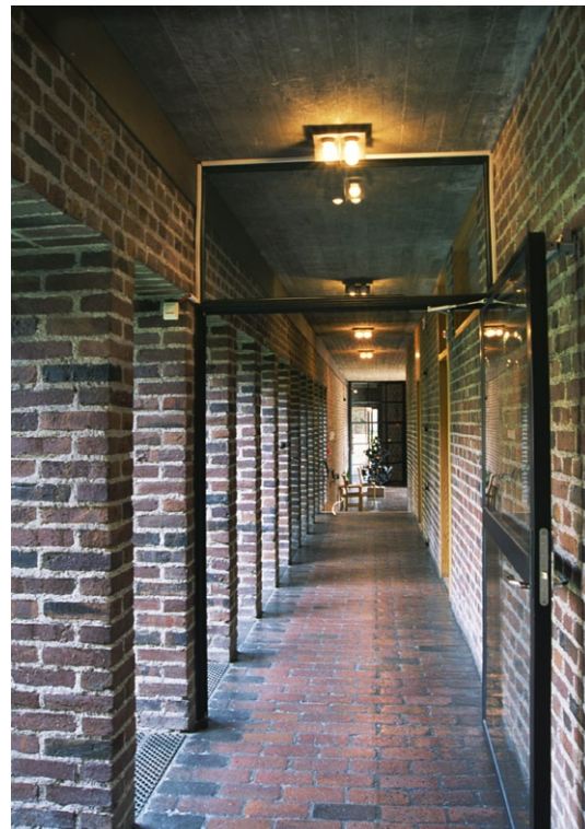
Korridor mellan vapenhus och församlingslokaler.

Från vapenhuset leder en korridor till byggnadens församlingsutrymmen. Korridorens ena sida vetter mot den kringbyggda gården. Från tegelgolvet sträcker sig höga, smala fönster i djupa nischer, vars tegelmurar liknar pelare kring en klostergård. På motsstående sida leder omålade furudörrar in till olika rum. Utmed gårdens södra sida ligger det sk vardagsrummet, ett samlingsrum kring ett pentry med bardisk. Golv och väggar är av tegel medan taket täcks av