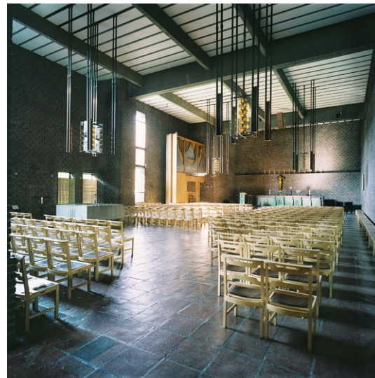
Kyrkorummet mot koret .

Den norra väggen är, undantaget ett högt och smalt fönster framme i koret , helt sluten.