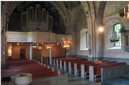
Interiör mot väster.

1882–83 görs utvändiga och invändiga arbeten i kyrkan då bl a västportalen breddas och får funktion av huvudentré. Portar med fyllningsdörrar sätt in. Samtidigt uppförs ett vindfång i nygotisk stil . Västgaveln har möjligen haft ett ursprungligt rundfönster som förstoras första gången 1761 och senare även 1883. Fasaderna kalkputsas åter och får nu sin struktur med spritputs och släta omfattningar, blinderingar och hörn samt avfärgas i rosa färgton. Nya öppna bänkar med gavlar av gjutjärn ersätter de