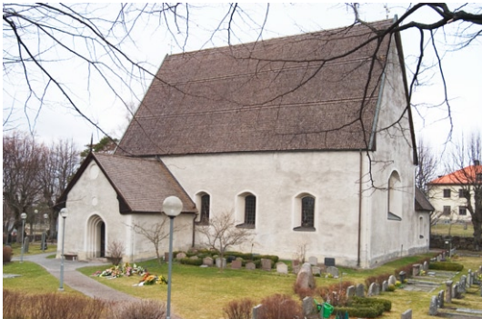
Exteriör mot sydost.

kyrkans murar i ett oputsat skick. Synliga lagningar i samband med ändrade muröppningar gjorde att fasaden åter putsades, nu med ett kalkcementbruk. Utformningen från sent 1800-tal, med spritputs och slätputs , behölls och fasadernas kalkcementbruk har 2005 kalkavfärgats. Träspån har troligen varit kyrkans takbeläggning sedan medeltiden.