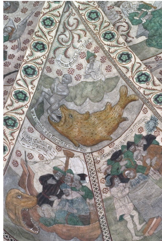
Detalj av valvmålning av Albertus Pictor.

är oidentifierad. Den rikt järnbeslagna ekdörren med stocklås är original från 1400-talet.