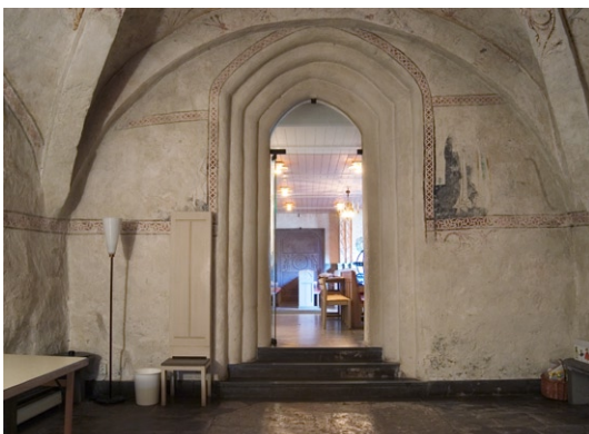
Sydportalen mot norr.

Vapenhusets kalkmålningar dateras till omkring 1500. De är blekta av tidigare överkalkningar och fragmentariskt bevarade. Upphovsmannen