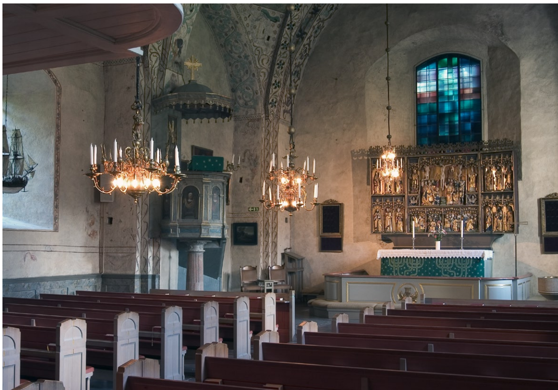
Interiör mot öster.

Predikstolen är tillverkad på 1630-talet av holländaren Kaspar Pantén för äldsta slottskyrkan i Stockholm. Den skänktes 1692 tillsammans med bänkar och inventarier av Carl XI till Täby kyrka. Predikstolen var till en början placerad på södra sidan, men flyttades 1757 över till den norra väggen, för övrigt den enda förändring som återstår av 1750-talets restaure-