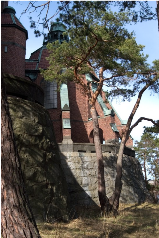
Det åttkantiga koret från söder.

Kyrkan har en påtaglig vertikal betoning med det väldiga sidoställda klocktornet och de släta murytorna, vilket förstärks av kyrkans höga placering. Kyrkan är orienterad i öst-västlig riktning och består av ett rektangulärt långhus , som i väster flankeras av två låga trapporn och i öster är förenat med ett åttkantigt kor under ett brutet tak som kröns av en kopparhuvsförsedd lanternin . Korets form förstärks med en