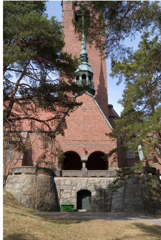
Exteriör från söder.

uppbyggd terrass i samma form där sex kraftiga strävpelare står. Mot norr och söder finns utbyggnader för sakristia respektive torn. Mot kyrkans enkla och strama exteriör står dess praktfulla interiör i stark kontrast.