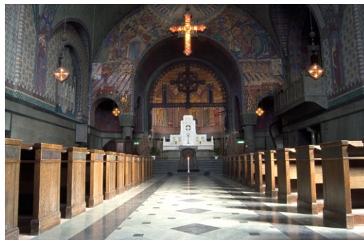
Kyrkorummet från väster.

Golvet är mönsterlagt av grön och svart marmor, förutom i bänkkvarteren som har trägolv. Långhusets väggar är nedtill klädda med mörk svensk marmor och kalksten. I den södra panelen finns två kors i guldmosaik (typ medeltida konsekrationskors ). Framför värmeelementen sitter konstsmidda elementskydd. Ovanför stenpanelen vidtar färgstarka och praktfulla kalkmålningar "al secco" som fortsätter i valvet och når sin kulmen i korpartiet . De non-figurativa målningarna är utförda av