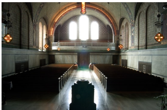
Kyrkorummet från öster.

Kyrkorummets belysning är mycket genomtänkt och fönstrens placering liksom det elek-