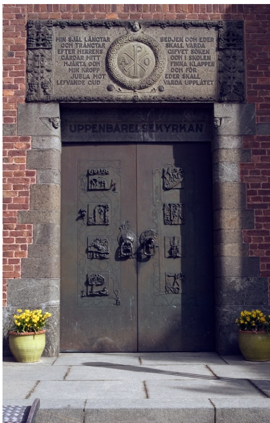
Kyrkans entréportal med Carl Milles bronsportar.

stjärnbilder samt den infällda granitplattan med bibelord och religiösa symboler ovanför västportalen.