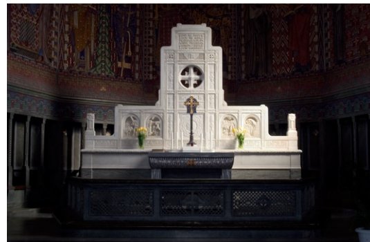
Det stora altaret i vit Carraramarmor från väster. Altarreliefer © CARL MILLES/BUS 2008

Dopfunten i mörk granit är utformad av Carl Milles med järnlock av Boberg. Till formen påminner den om romanska arbeten på Gotland eller i Sydsandinavien. Dopfunten har en ovanligt central placering mitt framför