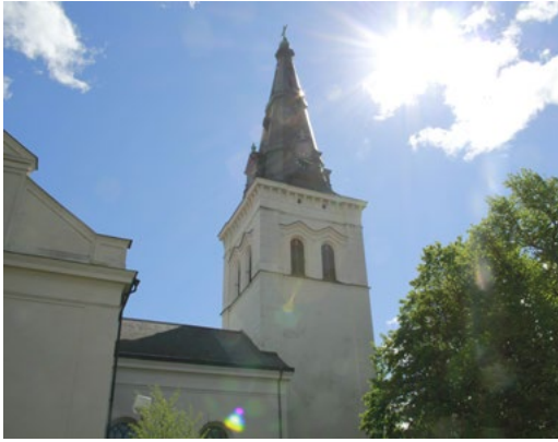
KARLSTADS DOMKYRKA