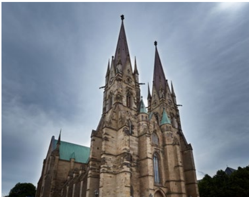
SKARA DOMKYRKA