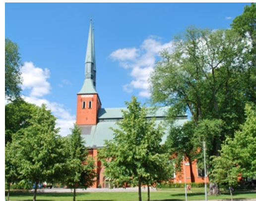
VÄXJÖ DOMKYRKA