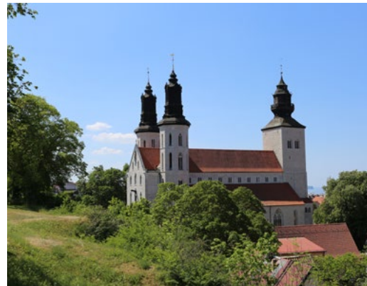
VISBY DOMKYRKA