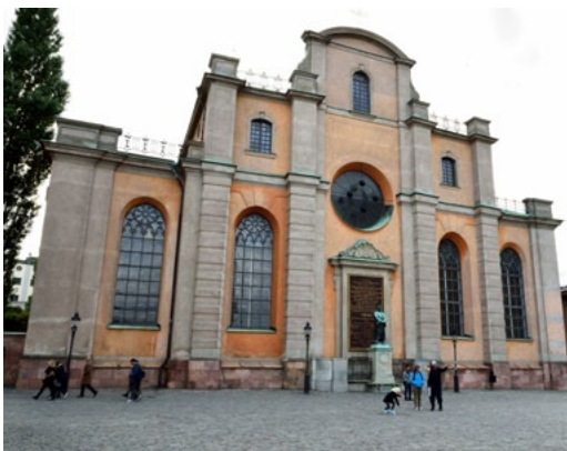
STOCKHOLMS DOMKYRKA - STORKYRKAN