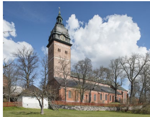
STRÄNGNÄS DOMKYRKA