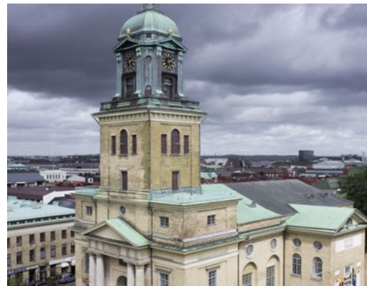
GÖTEBORGS DOMKYRKA