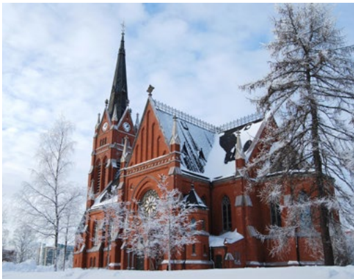
LULEÅ DOMKYRKA