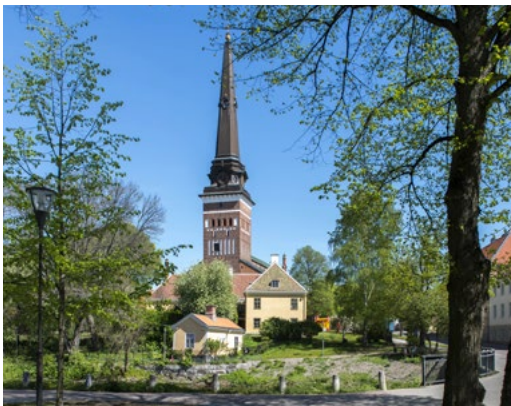
VÄSTERÅS DOMKYRKA