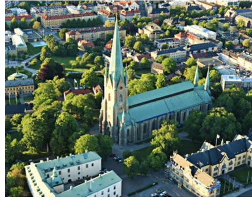
LINKÖPINGS DOMKYRKA