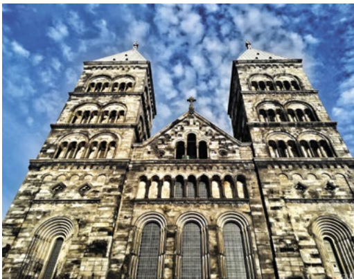
LUNDS DOMKYRKA