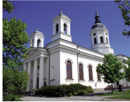
HÄRNÖSANDS DOMKYRKA