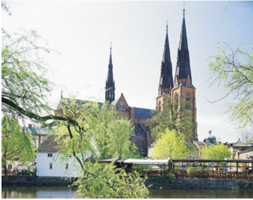
UPPSALA DOMKYRKA