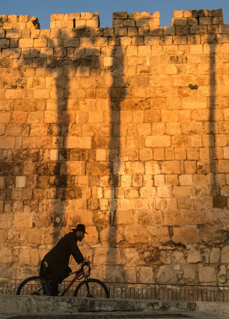
Utanför Gamla stan i Jerusalem, på väg mot Jaffaporten.