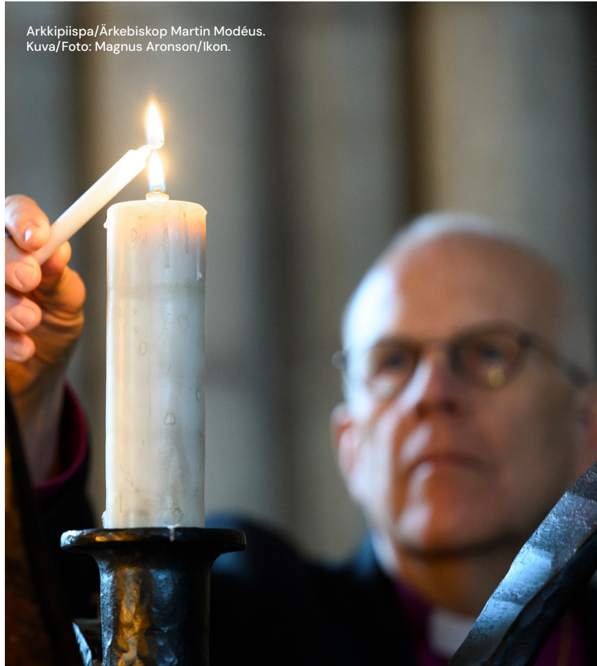
Arkkipiispa/Ärkebiskop Martin Modéus.