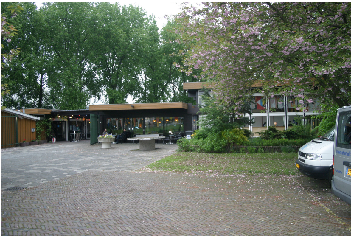
Heijplaat ligger övergiven.

Under de senaste åren har sjömanskyrkan i Rotterdam tvingats skära hårt i sin verksamhet. Annan välfärd har gått samma väg. Omsorgen om de ombordanställda minskar i ungefär samma takt som trafiken på en av världens största hamnar ökar. En lägesrapport.