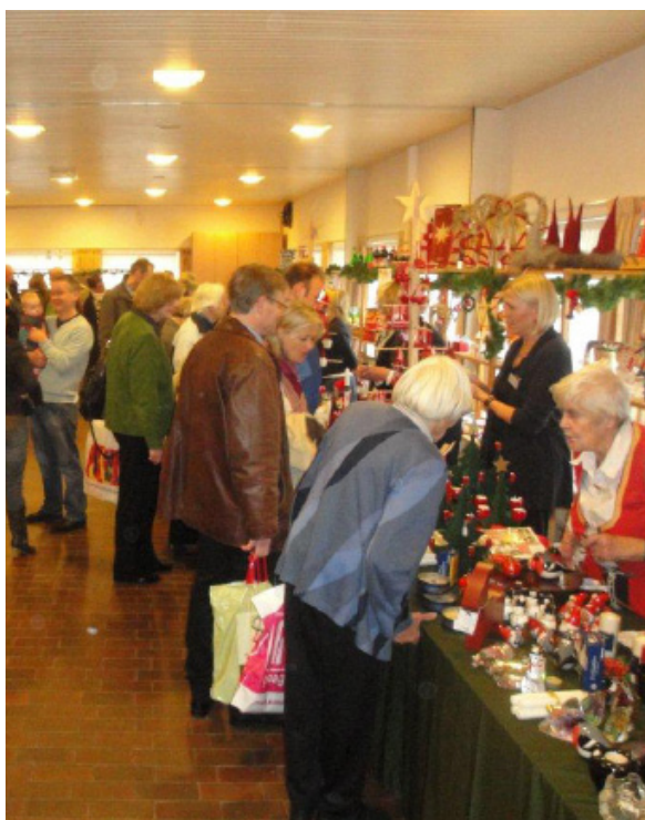
Förra årets basar i Amstelveen

Välkommen till våra fantastiska julbasarer. Här hittar du svenska hemslöjdsprodukter, julsaker, pappersvaror, glas, trä, textil, mat och godis. Vi serverar kaffe, kanelbullar, gyllene lussekatter, tårter, smörgåsar, ris a' la Malta, juldoftande glögg och pepparkakor.