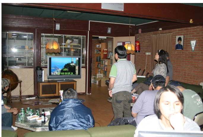
Sista karaokekvällen i Heijplaat. Nu är karaoken flyttad till Flying Angel.

Halvt på skämt tar en läsare upp en följd av utflaggningen; Allt fler ombordanställda är muslimer medan religiös välfärd nästan alltid levereras av kristna samfund. ”Borde man inte ha muslimsk välfärd?”