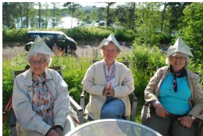
Åsljunga bjuder på härlig natur och underhållning i världsklass.