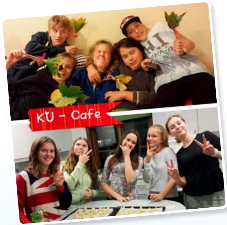
Teamwork på KU- Café och ledarsamlingarna i Kärda.