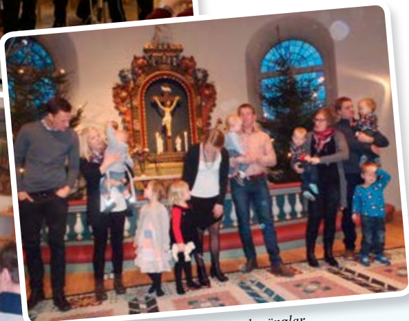
Utdelning av dopänglar.