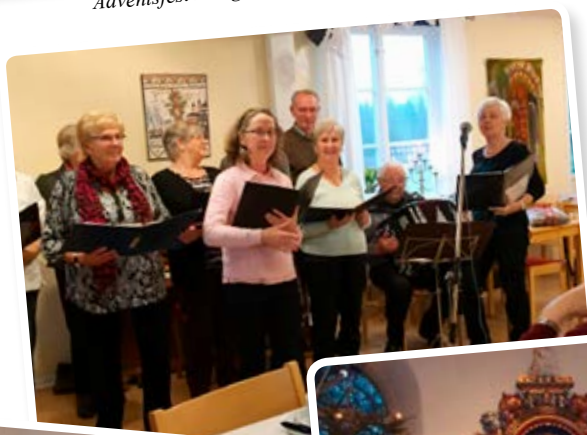
Adventsfest Hånger. Glada Röster sjöng och spelade.