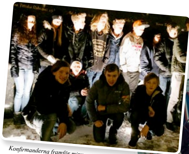
Konfirmanderna framför minnesmonumentet för diskoteksbranden

Bilder från konfirmandernas resa till Göteborg.