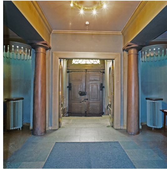
Vapenhuset mot väster.

Kyrkorummets långhus och korsarmar är kryssvälvda. Kraftiga pelare med breda gördelbågar emellan skiljer långhus och korsarmar åt. I söder, norr och väster finns läktare. De flesta av kyrkorummets fönster finns i korsarmarna. De är rundbågiga med innerbågar av smides-