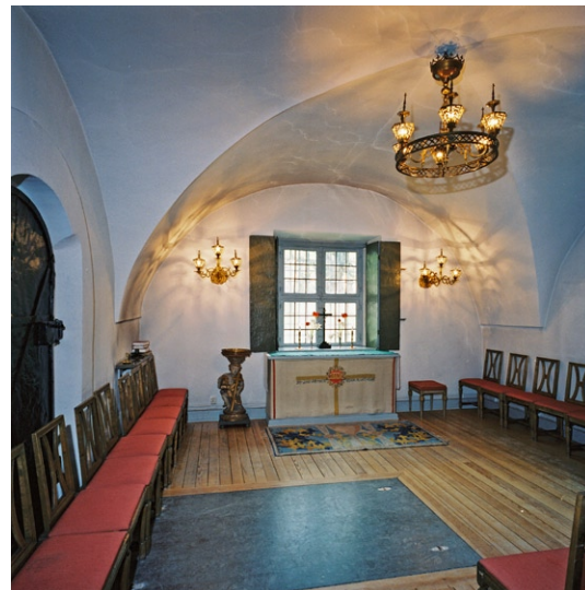
Kapellet med altare och dopfunt till vänster.

Lilla kapellet som nås från kyrkorummets sydvästra hörn har brädgolv med en gravhäll av kalksten, putsade och målade väggar samt kryssvälvt tak. Fönstren har träbågar med blyinfattat glas och vikbara fönsterluckor av järnplåt. Alta-