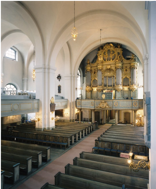
Kyrkorummet mot orgelläktaren.

Sakristian norr om koret har obehandlat brädgolv, putsade och vitmålade väggar samt kryssvälvt tak. En kalkstenstrappa med smidesräcke leder upp till predikstolen. De spröjsade fönsterbågarna är av brunlaserat trä. Vid fönstret i öster står ett marmorerat träaltare med gueridoner av trä från 1700-talet på var sida.