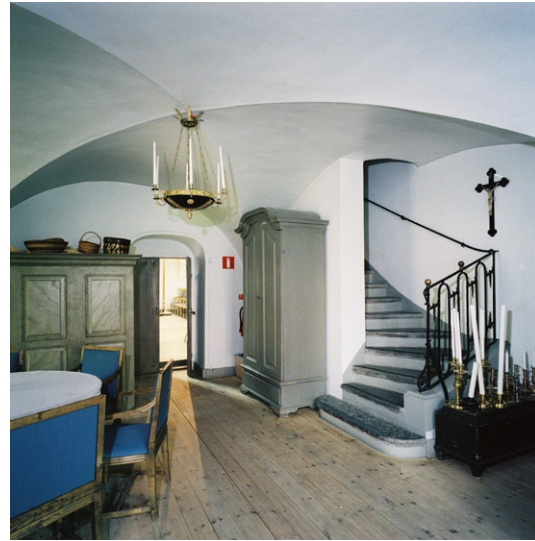
Sakristia med trappa upp till predikstolen.

Lilla kapellet som nås från kyrkorummets sydvästra hörn har brädgolv med en gravhäll av kalksten, putsade och målade väggar samt kryssvälvt tak. Fönstren har träbågar med blyinfattat glas och vikbara fönsterluckor av järnplåt. Alta-