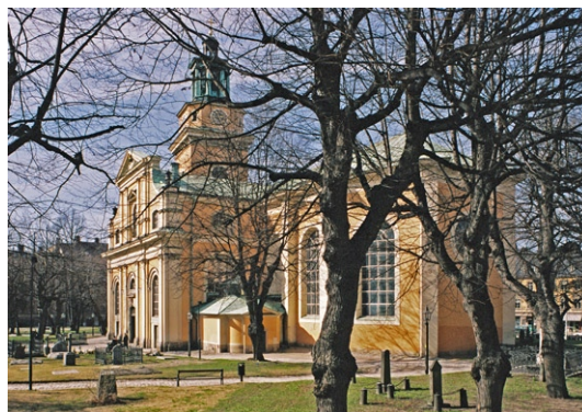
Exteriör från öster.

S:ta Maria Magdalena kyrka har putsade fasader i gult, en sockel av röd sandsten och koppartäckt tak. Korsarmarnas gavlar är prydda med listverk och lisener putsade i en ljusgrå kulör liksom fönsteromfattningarna. Gavlarna följer ett romerskt barockt formspråk och står i kon-