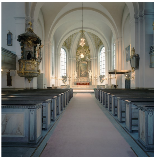
Kyrkorummet mot koret.

förgylld liksom ljudtaket. På motstående vägg i söder står en baldakin med textilt tak på en förhöjd plats. Här står dopfunten av rödbrun kalksten. Bakom den leder en grind med smidd dekor in till det som byggdes som sakristia men senare inretts som skrudkammare med väggfasta skåp. På var sida om dörren till sakristian i nordost står en kororgel respektive en flygel.