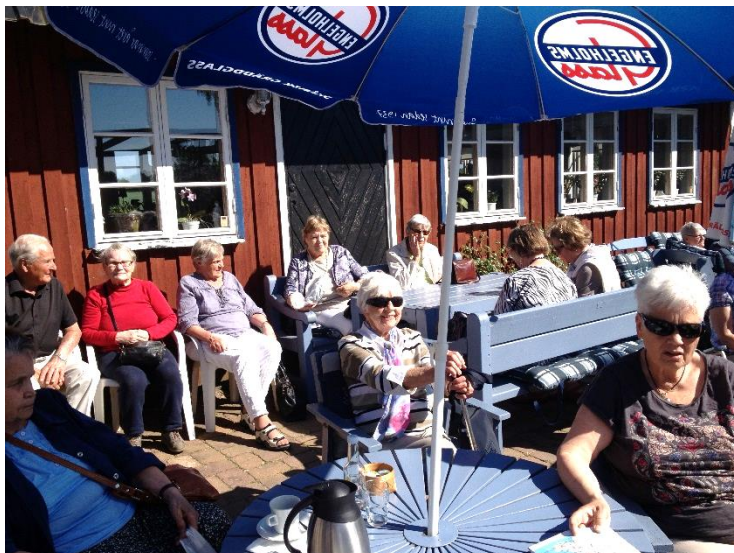
Många njöt av solskenet vid församlingens utfärd till bl.a. Bialitt.