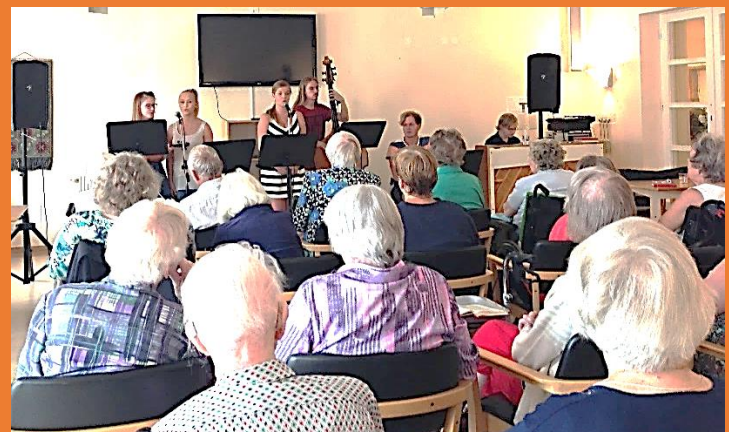
Sex sommarjobbade ungdomar glädde de boende på bl.a. Hemgården med sång och musik.