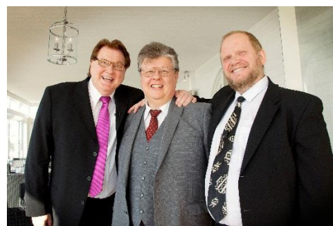
Gluntarne är utformade som dialoger mellan två studenter, Glutten (bas) och Magistern (baryton). De kombinerar en visaktig sångstil som påminner om Bellman, med avancerade partier stämsång, kontrapunkter och inslag av recitativ och arioso.

Frivillig gåva går oavkortat till insamlingen för Världens Barn. Biljetter kan hämtas gratis på Tyringe pastorsexpedition, biljetterna släpps den 25 augusti och måste hämtas senast onsdagen 24 september