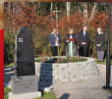
Högtidlig invigning i Västra Torup