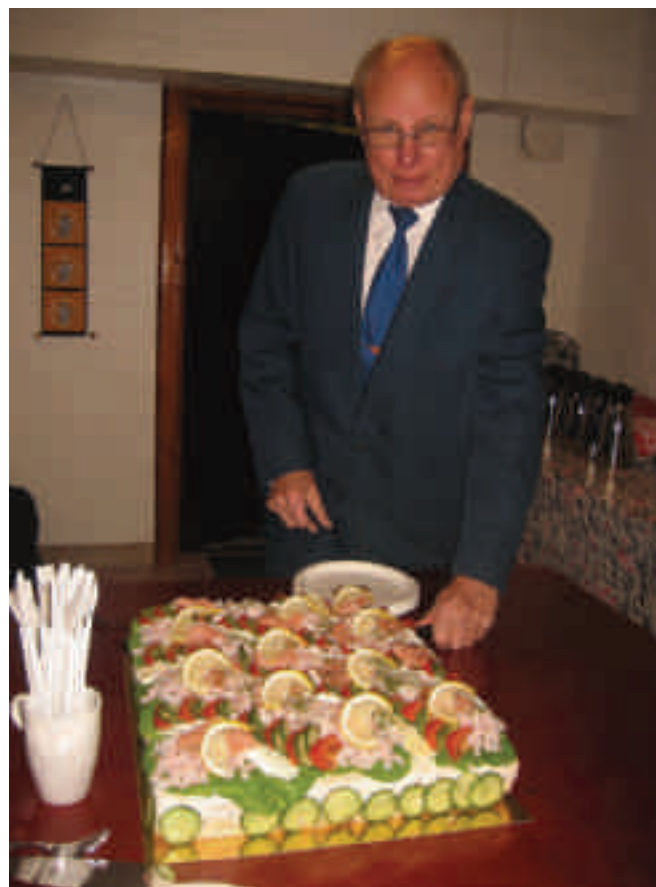
Sune avtackades med smörgåstårta.