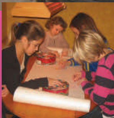
Söndagsskola i Röke sidan 4