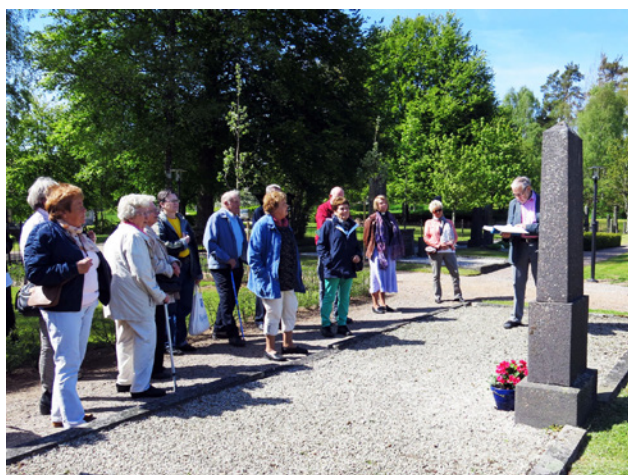
Kyrkogårdsvandring i Hörja - Pingstdagen 2015