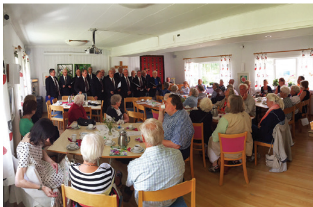
Bjärnums manskör i Västra Torups sommarkyrka