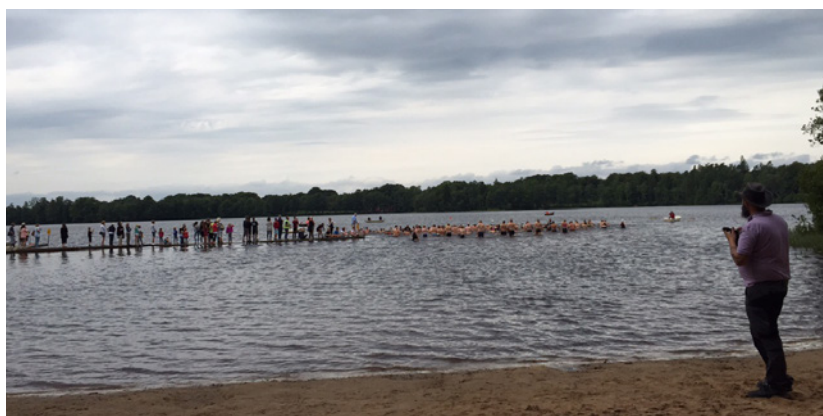
Vid Humlesjön - Triathlon Röke 8 augusti