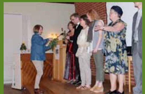
Modevisning i Röke, sidan 16