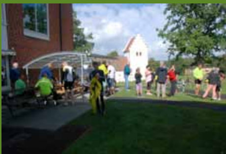
Cykla – för världens barn, sidan 3