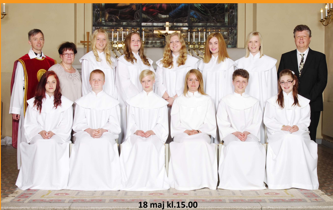
18 maj kl.15.00