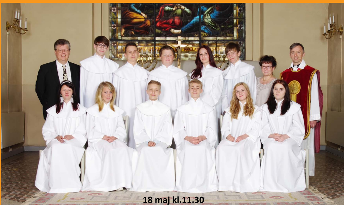
18 maj kl.11.30