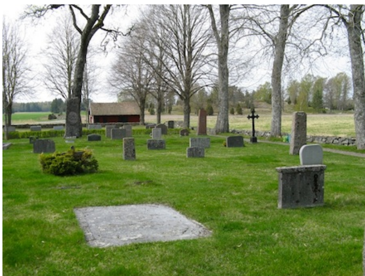
Kvarter 3 norr om kyrkan med en blandning av kyrkogårdens äldsta gravstenar och gravvårdar från 1900-talets mitt.

Den vitmålade, öppna klockstapeln består av tre bockar som vilar på naturstenar. Klockstapeln har en överbyggnad av stående träpanel och tälttak av kopparplåt som kröns av ett smitt kors. I stapeln hänger två klockor.