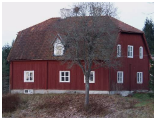
Heds kaplansgård från 1793 har bevarat ett ålderdomligt yttre

Öster om Hedströmmen, på en ås som sedan gammalt utgjort kommunikationsled, går landsvägen från Köping upp mot Bergslagen. På åschrönet ligger Heds kyrka med kyrkbyn strax nedanför. Närmast i slutningen mot nordost finns före detta folkskolan/klockarbostaden från 1865, en faluröd länga i två våningar, idag använd av kyrkogårdspersonalen och ortens hembygdsförening. Längre bort ligger församlingshemmet, uppfört 1921 som sockenstuga. En allé leder fram till kyrkoherdebostället, i privat ägo sedan 1999. Invid en avlång gårdsplan grupperar sig den reveterade huvudbyggnaden från 1798 och två timrade, faluröda flyglar. Mer avsidet, vid ett skogsbrunn i söder, ligger den före detta kaplansgården, timrad 1793.