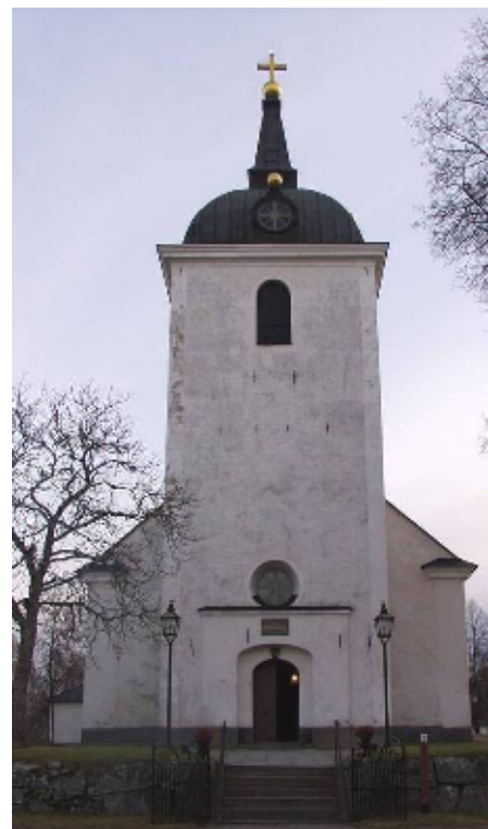
Heds kyrka i december 2004

Tornets mur är rak, utan avsatser, krönt med en karnisformig, kopparklädd huv. I huven sitter runda fönster, vars överstycken pryds med förgyllda kopparkulor. Längst upp kröner en låg spira, formad som en obelisk med förgyllt kors.