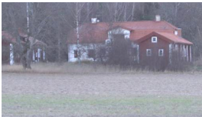
Huvudbyggnaden på Heds prästgård moderniserades kraftigt på 1950-talet. En varsammare renovering skedde sedan huset sålts till privatperson år 1999