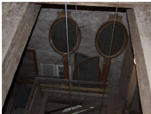
Uppe i tornet förvaras delar av 1905 års fasta inredning, uppflyttade dit 1949-50, då kyrkorummet på nytt ändrades – Digitalfoto Rolf Hammarskiöld

Vid nästa stora förnyelse 1949-50, efter handlingar av arkitekt Sven A Söderholm, borttogs mycket av 1905 års inredning i syfte att återskapa 1790-talets kyrkorum. De öppna bänkraderna ersattes med slutna bänkkvarter, vars fasader efterliknade den spegelindelade altarringen. Denna återfick i sin tur en mer ursprunglig grå färgsättning och marmorering, liksom predikstolen. Valvens och väggarnas schablondekorer togs bort, så även de tjockare putsåslagen från 1905. Kalkavfärgning skedde i enhetlig, bruten vit nyans. I enlighet med detta fick dörr- och fönstersnickerierna en neutralare, grå färg. Sakristian nyinreddes. Istället för den vedeldade centralvärmepannan infördes direktverkande el.