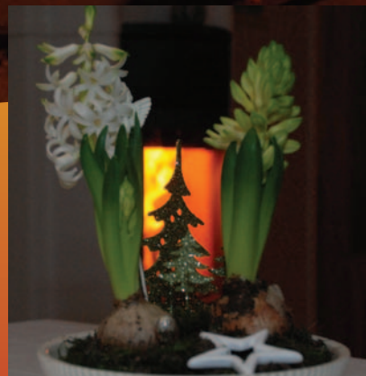
Julens gudstjänster och verksamhet sidorna 8-9