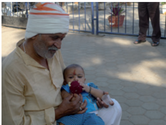
Män kan också passa barn.

När man går på huvudgatan MG-road kan man möta en toppmodernt klädd tjej i högklackat med senaste mobilen vid örat och femton meter senare en tjej i samma ålder, barfota, smutsig, tiggande pengar av alla hon möter. Kontrasterna blir påtagliga. Jag mötte en man i bokaffären som visste att alla i Sverige är väldigt rika. Vi tog en diskussion om det, de flesta i Sverige har vad som behövs materiellt, men vi enades om att norrmännen är rikare.