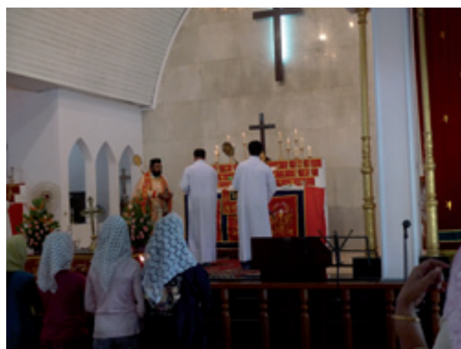
Gudstjänst i Mar Thoma Church, Tomaskyrkan.