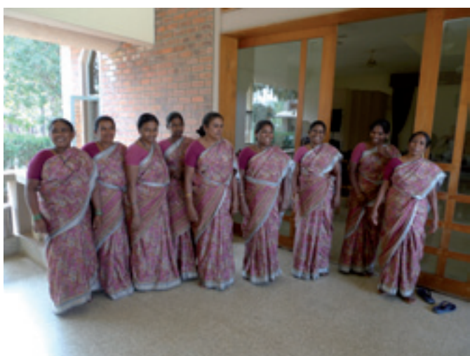
Städerskorna i sina uniformer.