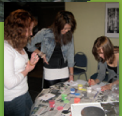
Möt våra härliga ungdomar Sid. 12