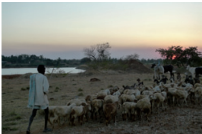
Djuren förs hem i skymningen.

Vi gick en promenad före solnedgången och ”the green pastor” berättade om hur man planterar ris på ett speciellt sätt för att slippa giftbekämpning. I Indien har man gått direkt från bondesamhälle till IT-samhälle och det finns en vision om att slippa göra våra misstag med miljöförstörande gifter.