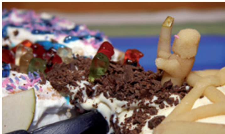
"Mandelmasse-Mose hälsar Israels gelébjörnar välkomna till det utlovade landet bortom Röda havet efter UG:s tårttävling."