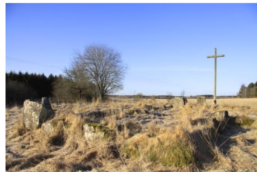
Gamla kyrkplatsen på Höljebacka

de andra kyrkorna i pastoratet och övertalade församlingsborna att istället bygga en stenkyrka på Nyckleby ägor intill landsvägen. Det kan förtjäna att påpekas att kyrkans kassa 1723 endast bestod av 382 daler varav en del var reducerade s.k. nödmynt. Kreitlow reste till Göteborg och lyckades få en stiftskollekt beviljad, vilken gav 120 daler i tillskott. Från Kunglig Majestät fick man nådigt tillstånd att flytta kyrkan till en ny plats.