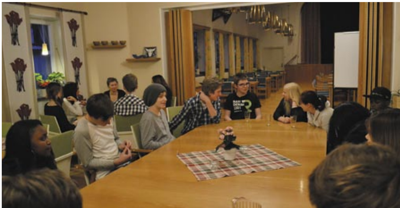
Torsdagsgruppen i samtal inne i Mikaelsgården.

Nu är församlingarnas konfirmandarbete i full gång. Vi har i år två grupper med konfirmander, en som träffas på torsdagar och en som träffas ett antal helger under året. Båda grupperna har även ett antal unga konfirmandledare som hjälp och som förebilder. Tillsammans har grupperna under hösten varit på läger på Stiftsgården i Rättvik och innan det är dags för konfirmerationer så kommer vi även att åka på läger på Finnåkers kurs- och lägergård.