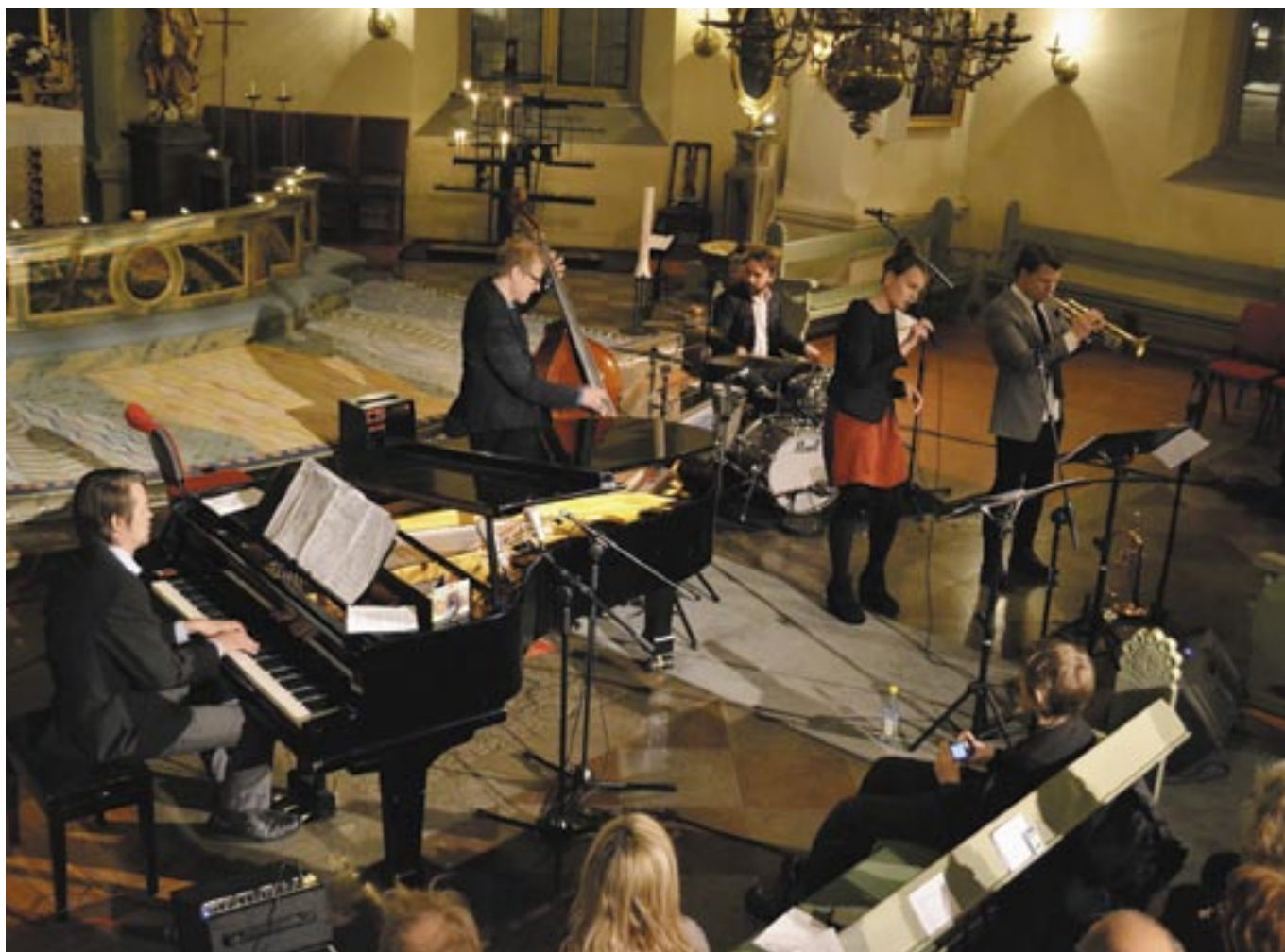
Bild från releasekonserten för CD-skivan i Kristina kyrka den 22/1 2012.