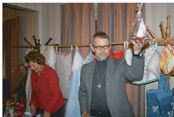
Auktion i Kyrkstugan 2005.