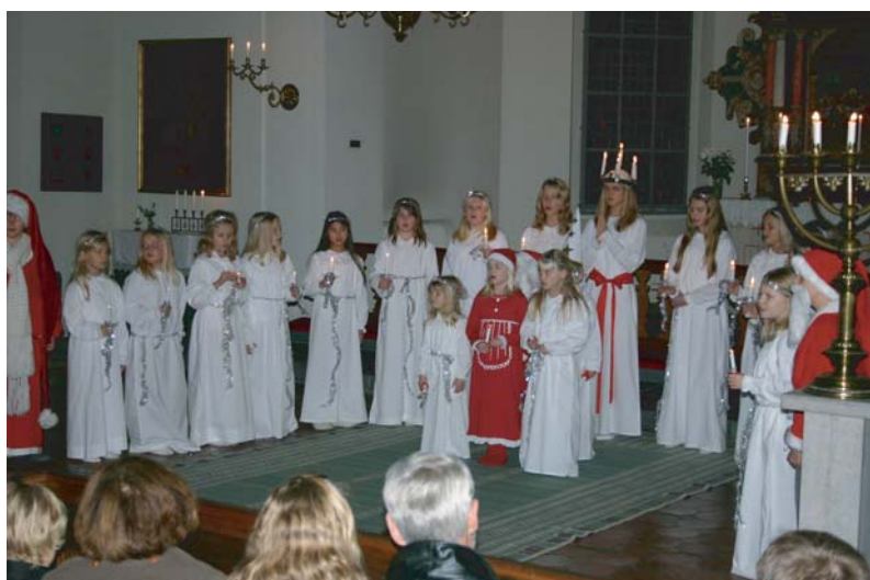
Luciafirandet i södra Åby kyrka 2005.