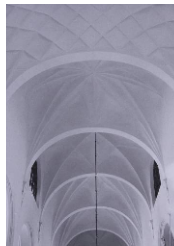
Övre bilden: Södra sidoskeppets kapell, inramat av skrankverk och inrett med lösa bänkar, fanns åren 1966-82. Nedre bilderna: Valven före och efter renoveringen 1965-66. Under de gångna 40 åren har putsytorna åter blivit nedsmutsade, dock inte fullt så kraftigt som på bilden till vänster.

Södra sidoskeppets kapell med omgivande skrank bestod bara till 1982, då istället en kororgel installerades. Den tillverkades med förlaga i den Cahman-orgel kyrkan hade på 1700-talet. 300 av de totalt 1900 piporna härrör också från denna. Ytterligare en inre förändring som bör nämnas är det centralt placerade altarbord som kom på plats 1998.