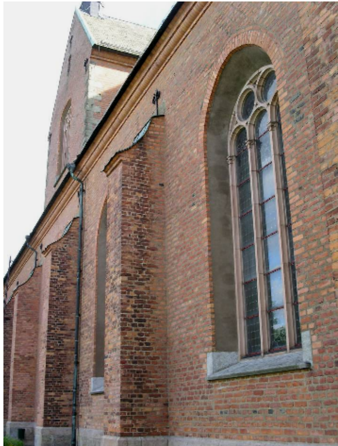
Norra fasaden

Ovan sockeln av planhuggen, gråröd granit består murarna av tegel i renässansförband. De ursprungliga teglen, brända i Rankhyttan, är ganska ojämna och skeva, med följderna att murfogarnas bredd varierar avsevärt. Vid lagningar gjorda på 1900-talet har maskinslaget tegel lagts in, främst runt fönster och närmast sockeln, där fogarna är jämnare. Murarna stöds runt om av strävpelare och kröns av en taklist med enkel formstensprofil. Omfattningar på torn och tvärskepp har skulpterats av granit. De rundbågiga fönstren fick dagens utförande vid ombyggnad 1903-06, med masverk av Orsasandsten som inramar dubbla rutor, de yttre i järn. Tre portaler finns; i väster genom tornet och genom norra och södra tvärskeppens gavlar. Omfattningarna är av granit omväxlande med tegel. Portalerna stängs av kopparklädda dörrar, tillverkade 1906 som efterbildningar av original från 1670-71 respektive 1683, vilka införts i kyrkomuseets samlingar.