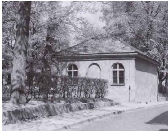
Gravkapellet och den dåvarande, låga kyrkogårdsmuren

Kristine kyrka ligger öster om det starkt sluttande Stora torget i Falun, inom område av riksintresse för kulturminnesvården. Kyrkogården är sedan länge avlyst för begravingar och inhägnas delvis av häckar. Arton gravar finns kvar, skyddade av kulturminneslagen. Tomten har under 1900-talet krympt i omfång. Mest drastisk var Trozgatans bredning 1956, som skedde på bekostnad av dåvarande kyrkogårdsmur, samt ett gravkapell i linje med södra muren.