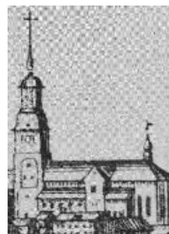
Kristine kyrka omkring 1700 – efter Erik Dahlbergs Suecia