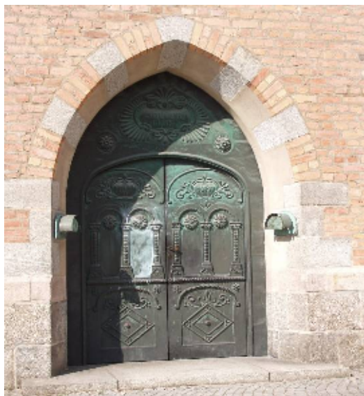
Södra portalen och vapenhusets kryssvalv

Huvudingång är västra portalen, vilken leder till ett litet kryssvälvat vapenhus. Fem gravhällar finns infästa i väggarna. En glasad pardörr leder genom ett boaserat vindfång vidare inåt.