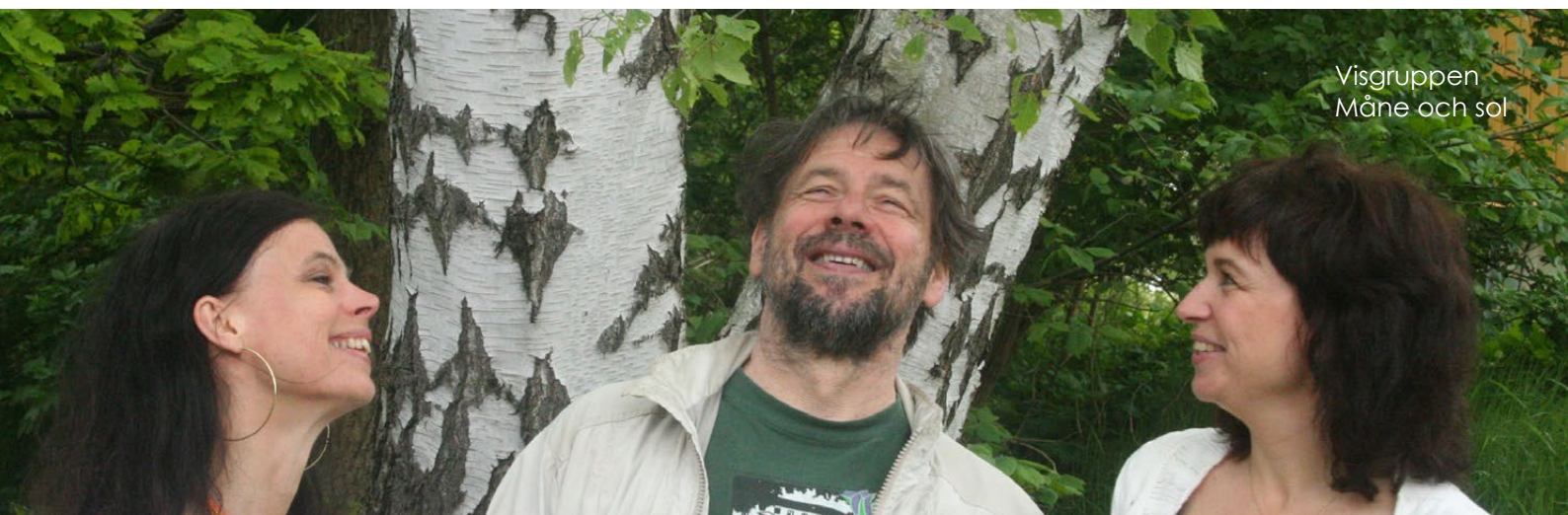
Visgruppen Måne och sol