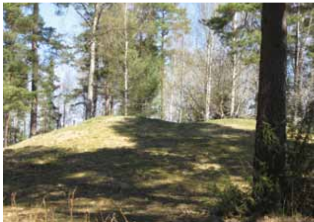
Friluftsgudstjänst på kung Skutes hög den 11 augusti tillsam- mans med Bälinge församling och Lyckebo kyrkan.

SÖNDAG 14 JULI Kristi förklarings dag 18.00 Gudstjänst