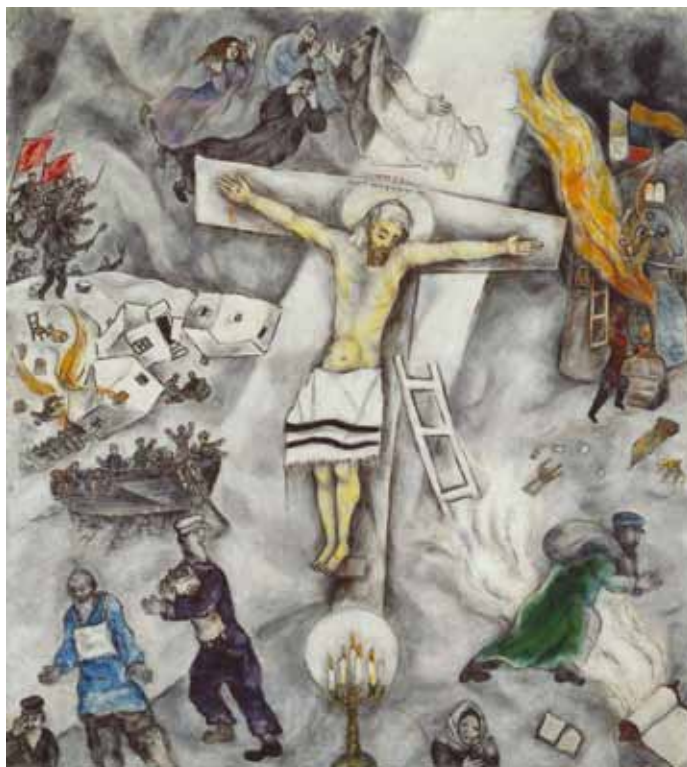
White crucifixion ©Marc Chagall / BUS Art Institute of Chicago, 2012

E-post: vattholma.pastorat@svenska-kyrkan.se