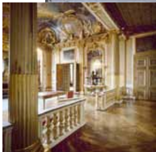
Gustav III:s paradsängkammare på Kungliga slottet