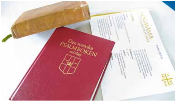
Bibel, psalmbok och gudstjänstagenda - stommen i gudstjänsten. Men i samtal kring bibeltexter, psalmer och gudstjänst kan man få vara med och prägla och fördjupa sig i gudstjänsten innehåll.