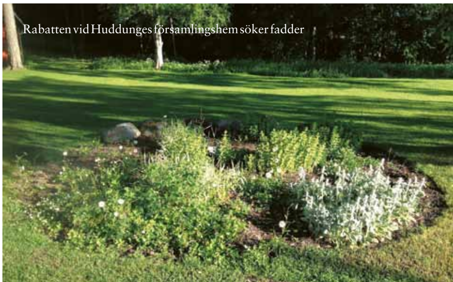
Rabatten vid Huddunges församlingshem söker fadder