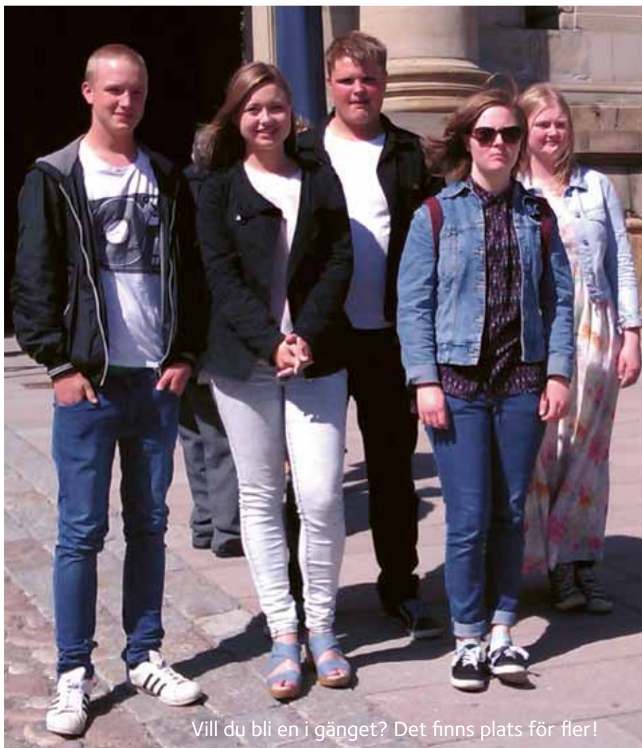
Vill du bli en i gänget? Det finns plats för fler!