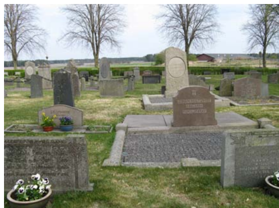
Variation med gravstenar av olika ålder och storlek.