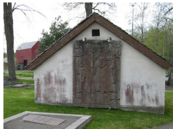
Bårhuset med Lasse Sabels gravhäll från 1600-talet.