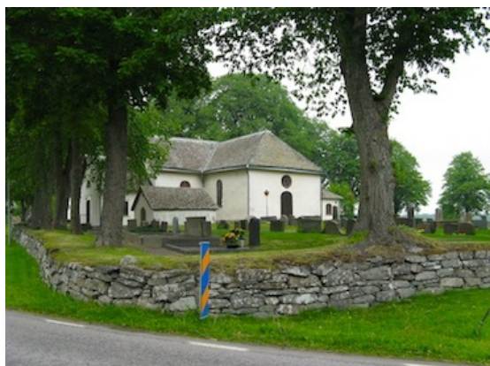
Kyrkogården från sydväst. Kyrkogårdsmuren och trädkransen är viktiga inslag i kulturlandskapet.

Utanför kyrkogårdsmuren i norr finns en personalbyggnad, med faluröd träpanel, uppförd under 1900-talets första hälft.