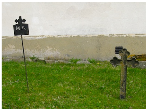
Järnkorsen som står intill kyrkan.