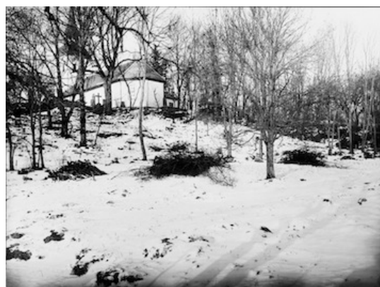
Foto från 1937 på det blivande utvidgningsområdet, öster om äldsta delen av kyrkogården.