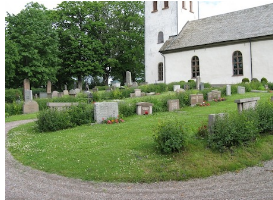
Låga, breda gravstenar i kvarter 4.