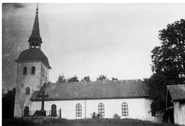
Foto från 1913. Till höger i bild syns en ekonomibyggnad som är riven.