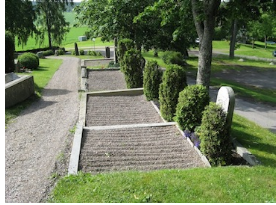
Rad av grusgravar i kvarter 2.