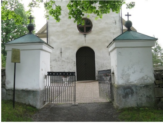
Ingång till kyrkogården med putsade grindstolpar.