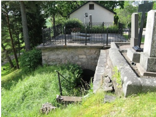
Ingång till gravkammare.