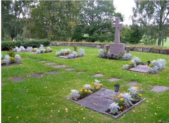
Kvarter 10 med Guldkungens korsformade gravsten.