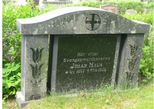
Gravsten från 1938 med titeln Svenskamerikanaren.