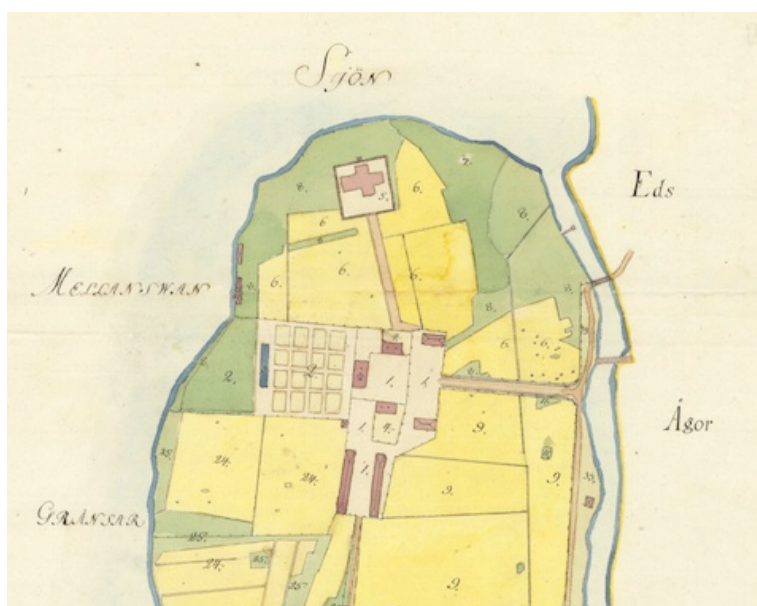
Karta från 1788 där den gamla kyrkogården kring kyrkan syns. Söder om kyrkan ligger Svaneholms herrgård. Karta från Lantmäteriet.

1838 byggdes en vintergrav mellan kvarter 1 och 4, på den plats där det idag finns en fontän. 1870 utvidgades begravningsplatsen. På 1880-talet ska alla kvarlevor av de begravda inne i kyrkan ha flyttats ut och begravts i nordvästra hörnet av den gamla kyrkogården.