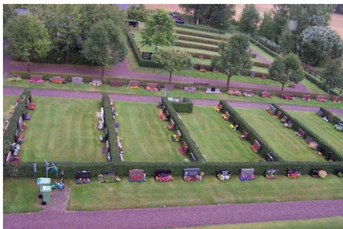
Kvarter 5 och 6 från 1940-talet närmast i bild och kvarter 9 anlagt på 1980-talet längre bort. Denna del av kyrkogården karaktäriseras av rygghäckar och breda, låga gravstenar.

Kvarter 7 och minneslunden ligger tillsammans, i kyrkogårdens nordöstra hörn, avgränsade av en häck. Minneslunden började användas på 2000-talet. I kvarter 7 finns plats för upp mot 40 urngravar, men än finns bara ett fåtal. In till kvarteret och minneslunden leder en gång av röd marksten som bildar en cirkel mitt i minneslunden, på vilken en utsmyckning med blomsterplantering, vatten och stenvägg finns.