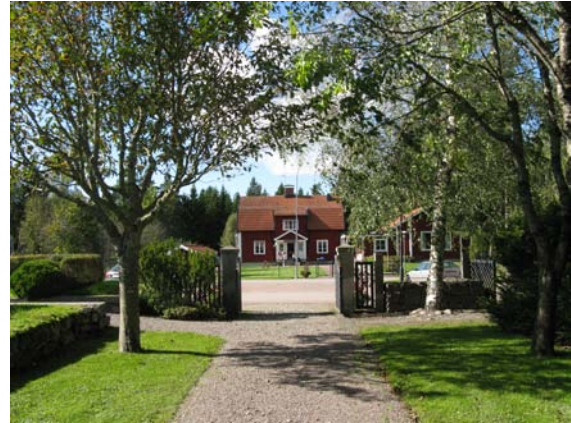
Vy från kyrkogården mot skolan på andra sidan vägen.