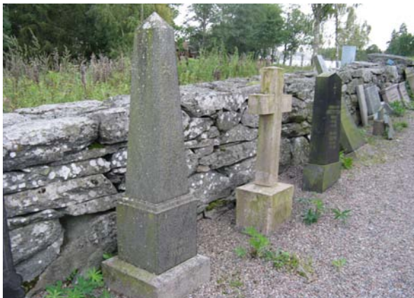
Flyttade gravstenar längs kyrkogårdsmuren.