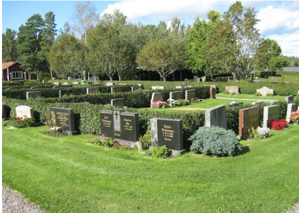
1940-talets kvarter med rygghäckar.