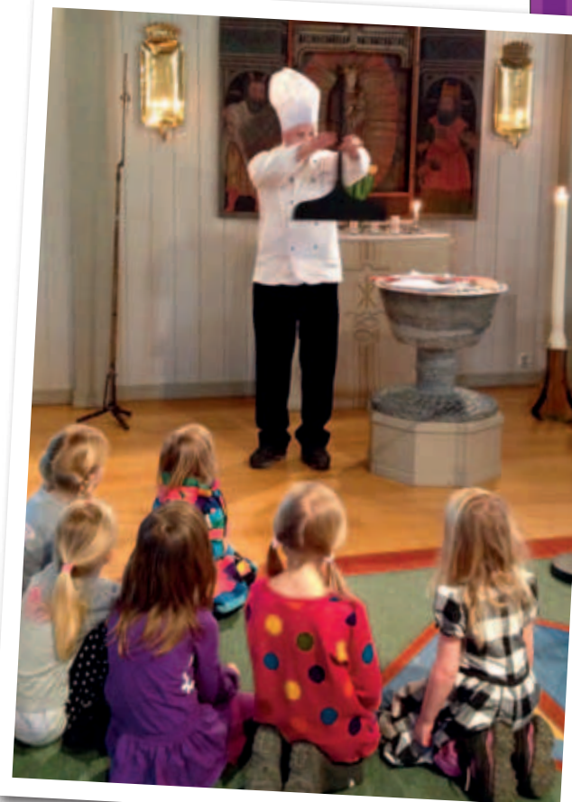
Arbetet med att utforma gudstjänsterna så att de passar både små och stora människor är en viktig del i Hammarö församling.