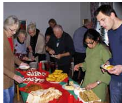
Över 80 personer gästade Mötesplats Cafété i Klagstorp i december!