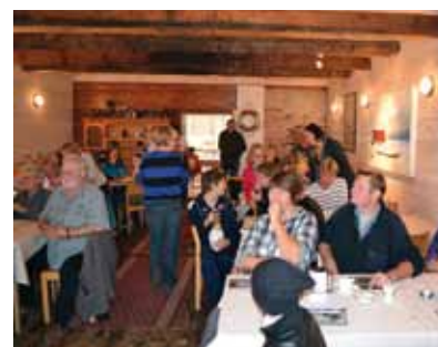
Mys efter höstens lopp!

Välkommen att delta i Livsloppet där vi kombinerar en stunds motion med att samla in pengar för Svenska kyrkans internationella arbete. I år vänder vi på det. Vi startar på Thurevallen (idrottsplatsen) i Beddingestrand och slutar i Östra Torps nyrenoverade församlingshem där vi får mumsa på de efterlängta våfflor. Det är flera som vill sponsra Livsloppet, så det finns många fina priser att vinna. För mer info se annons, hemsida och affischer.