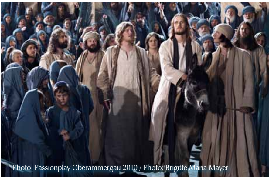
Photo: Passionplay Oberammergau 2010