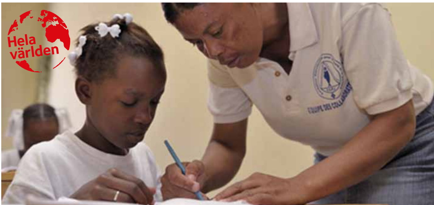
Utbildning betyder utveckling, men många barn är hungriga och orkar inte med skolan. Så kan vi inte ha det! Bilden är från Haiti.