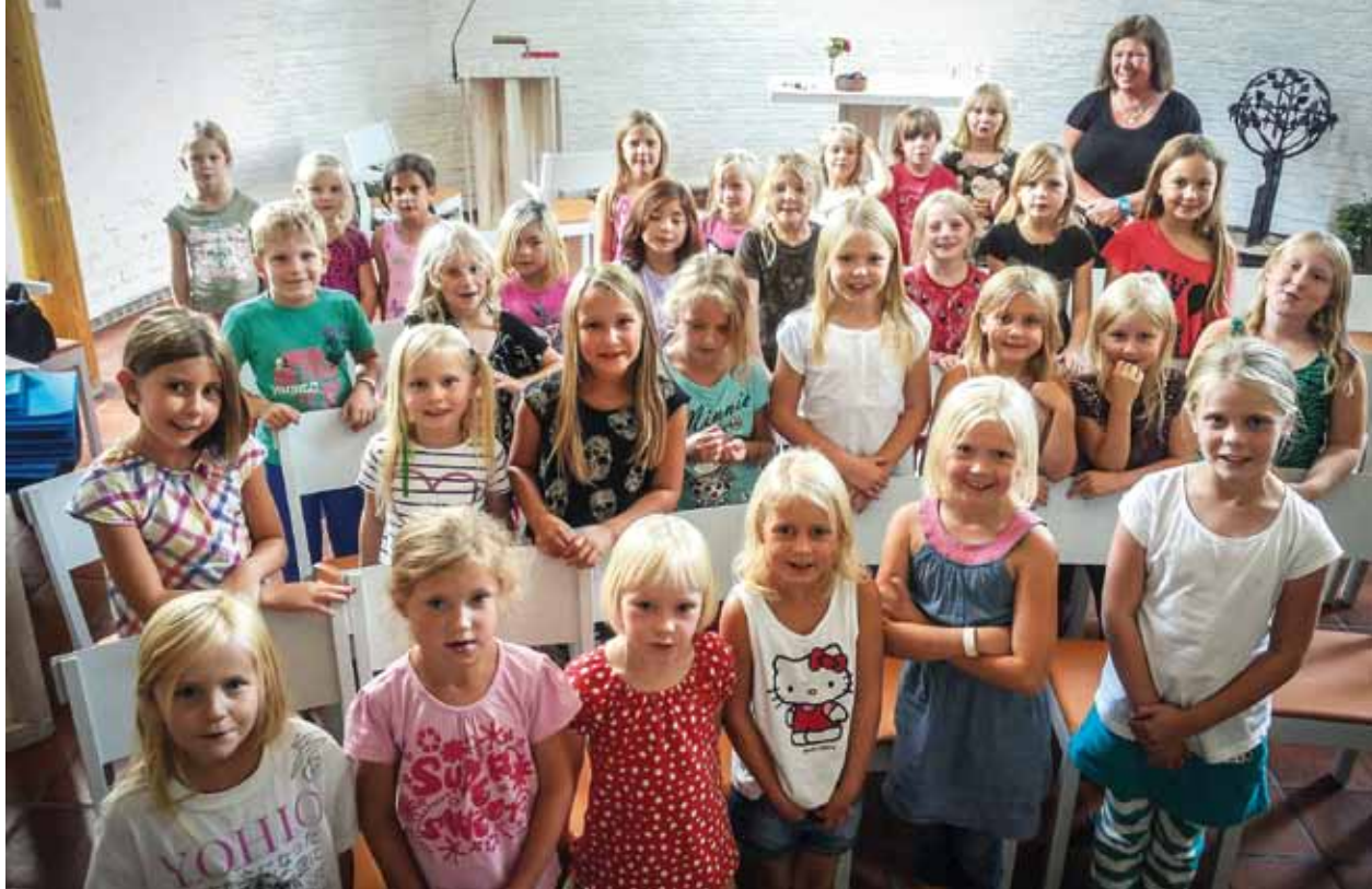
Sångsvamparna i Ärentuna församling har slagit rekord, nu vi är 35 sångare! Vi sjunger och fikar. Mest övar vi till familjegudstjänsterna.