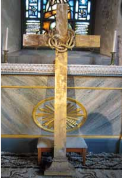
Ett kors som tidigare stått på altaret