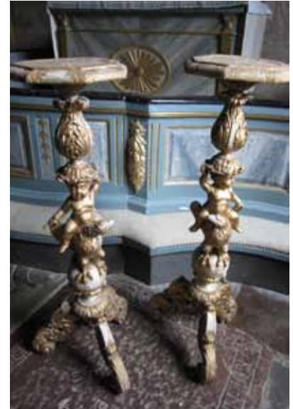
TVå geridonger som använts i kyrkan.