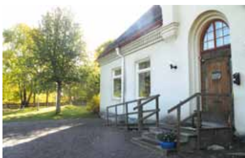
Trekanten, ett gammalt hus som under årens lopp haft en mängd olika funktioner. Nu är det församlingshem i Lena församling