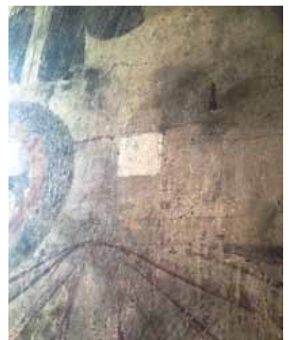
I Tensta kyrka (överst) och Ärentuna kyrka (nederst) har man provrengjort ett mindre fält. Där kan man se skillnaden mellan dagens mörkare yta och hur det kommer att se ut efter rengöringen.

KYRKBÄNKEN utges av Svenska kyrkan i Vattholma pastorat. I pastoratet ingår Ärentuna, Tensta och Lena församlingar.