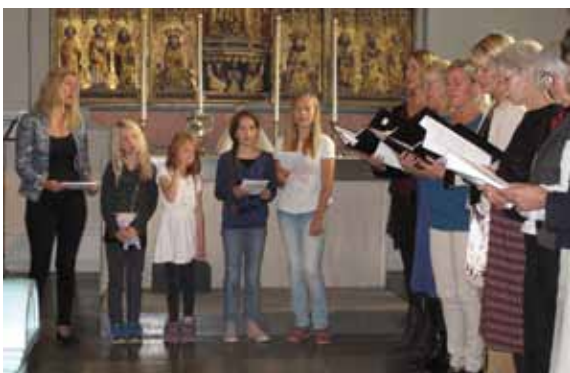
Barnkör och kyrkokör sjöng ett par änglasånger tillsammans under mässan.