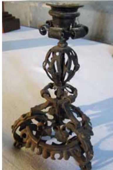
En av de två ljusstakarna som hittats