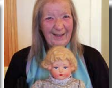
Arbetskretsens höstmärknad i Fuxerna 23/11.